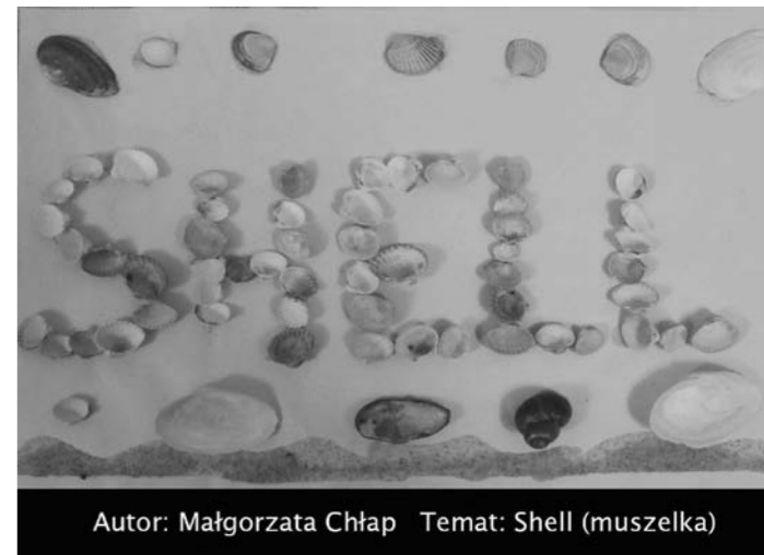
Autor: Małgorzata Chłap Temat: Shell (muszelka)

Kaligram to plastyczna kompozycja liter i symboli graficznych, obrazujących znaczenie przedstawianego wyrazu. Będąc „rysunkiem słowa”, kaligram w języku angielskim powinien być czytelny i zrozumiały dla każdego odbiorcy, niezależnie od tego czy zna on język angielski czy też nie. Celem konkursu było więc przede wszystkim uświadomienie uczniom, że nauka języka angielskiego może być jednocześnie wspaniałą zabawą. Dzieci zaprezentowały swoje talenty artystyczne, wykorzystując je w celu pomocy sobie i innym w nauce nowego słownictwa z języka angielskiego. Zadaniem uczestnika konkursu było