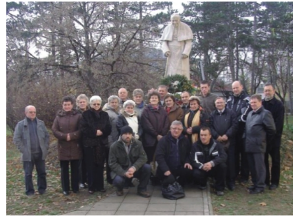
Delegacja pod pomnikiem Jana Pawła II w Budapeszcie