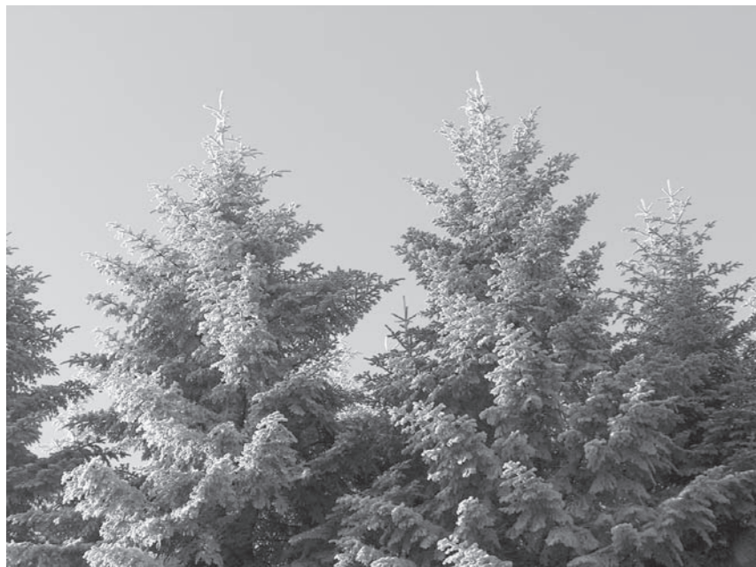
Fot. Stanisław Lis