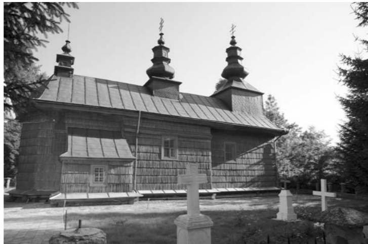
Cerkiew w Zawadce Rymanowskiej