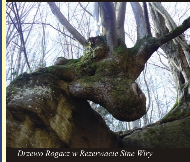
Drzewo Rogacz w Rezerwacie Sine Wiry