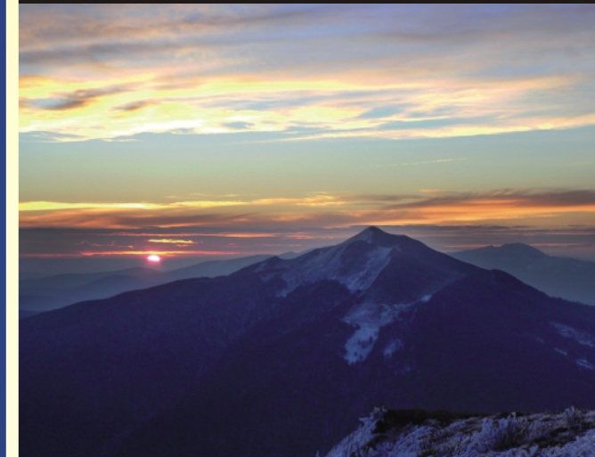
Świt na Połoninie Wetlińskiej