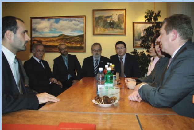
Spotkanie delegacji z Kazachstanu z władzami gminy.