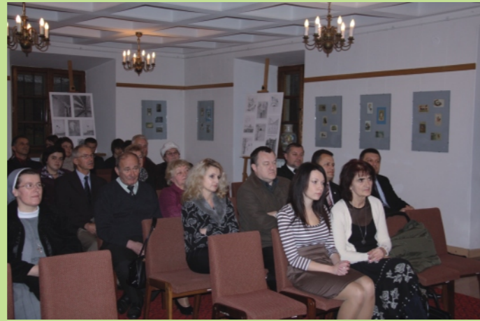
Uczestnicy spotkania w muzeum.