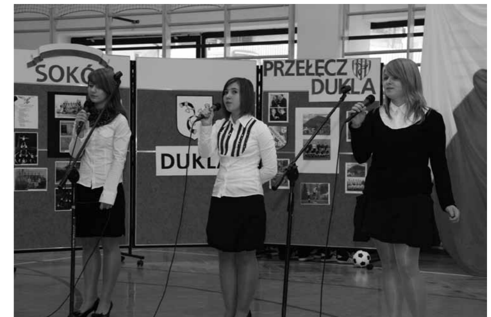
Występy artystyczne uczniów nowej szkoły.