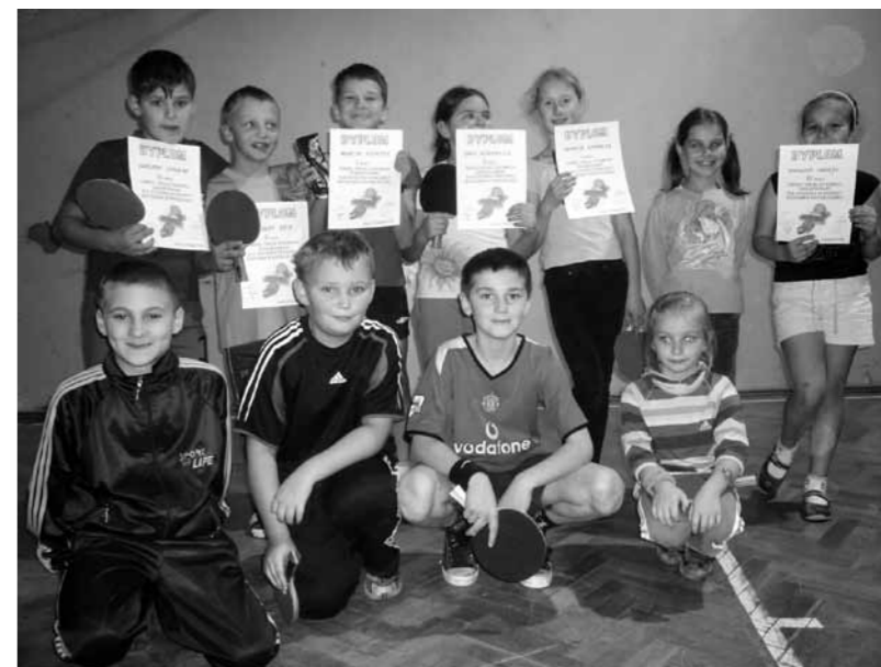
Zawodnicy z kategorii żak.

Życzenia spokojnych i radosnych Świąt Bożego Narodzenia oraz pomyślności i sukcesów w Nowym Roku dla wszystkich instytucji i firm wspomagających nasz klub, a także sympatyków tenisa stołowego składają