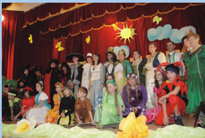
Zespół Równianie w inscenizacji "Dwa światy".