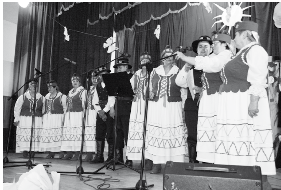
Zespół Równianie w nowych strojach.