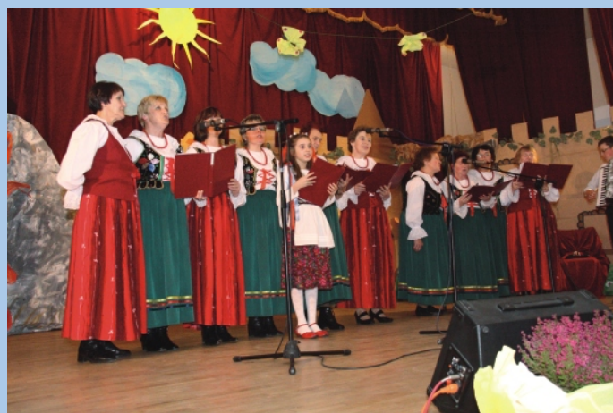
Gościnnie wystąpił Zespół Wietrznianie.