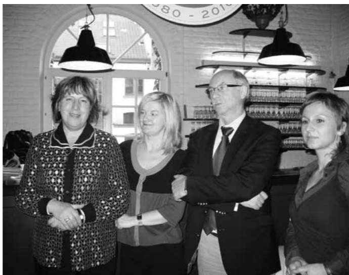
Spotkanie z komisarzem Januszem Lewandowskim.

Lunch z Komisarzem Lewandowskim tuż po ogłoszeniu zerwania negocjacji w sprawie budżetu EU był dla nas okazją do pogłębienia wiedzy w