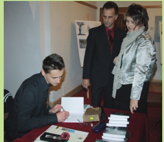
Młody dramaturg wpisuje dedykację (na zdj. pp. Bałonowie).