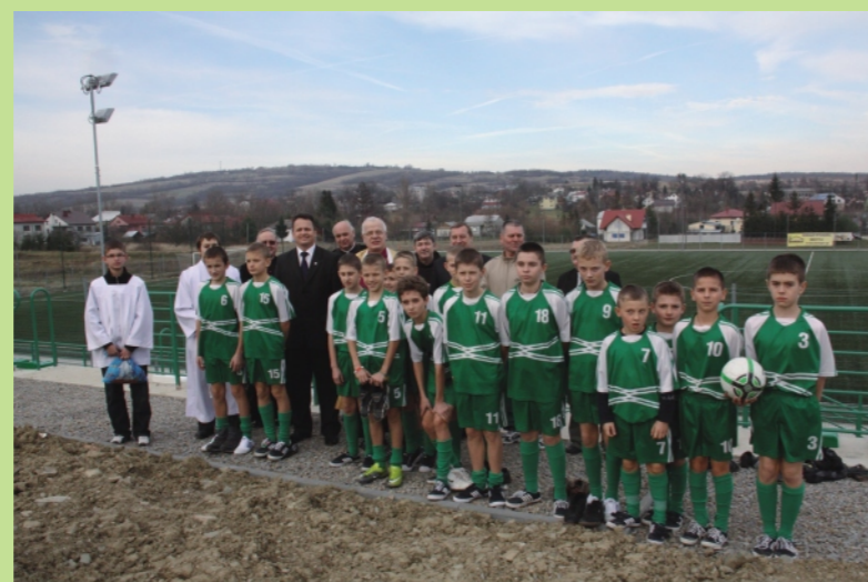
Uczniowie i goście przy nowym boisku sportowym w Dukli.