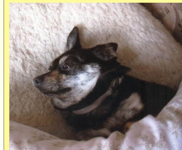
Fot. Suczka Misia - pupilka pani Zosi.

Publikujemy zdjęcia ulubionych czworonogów Czytelników Dukli.pl.