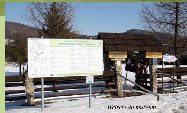
Wejście do muzeum.