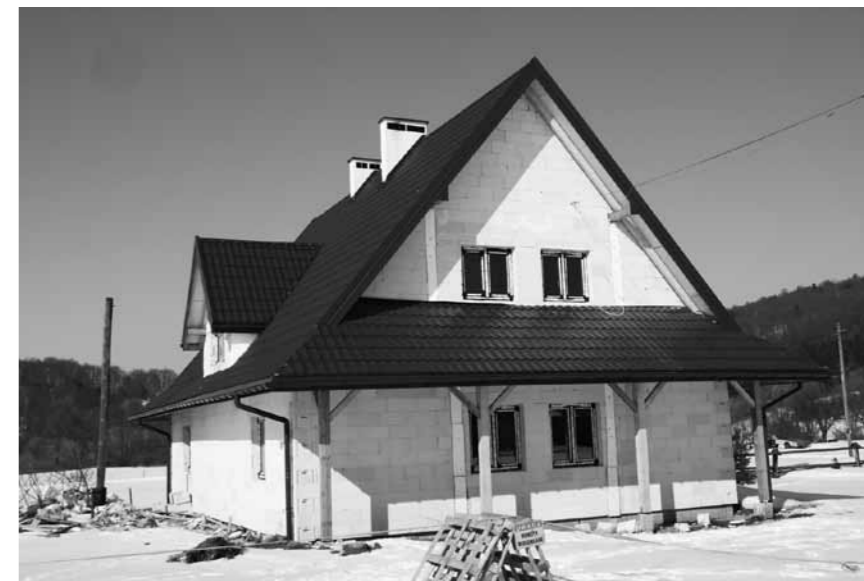
Pawilon wystawowy - stan surowy.