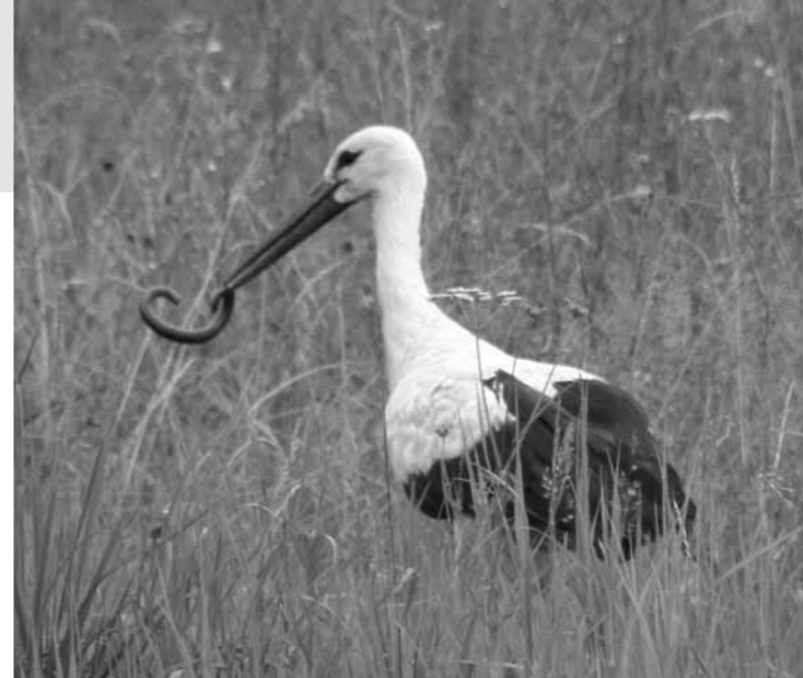
Bocian biały - fot. Zbigniew Panek.

W Polsce bocian czarny jest objęty ochroną ścisłą (Rozporządzenie Ministra Środowiska z dnia 28 września 2004 w sprawie gatunków dziko występujących zwierząt objętych ochroną). Dodatkowo nie obejmują go odstępstwa od zakazów dotyczących zwierząt chronionych oraz ma status gatunku wymagającego ochrony czynnej. Wokół jego gniazd tworzy się strefy ochronne: w promieniu około 100 m – strefę ścisłej ochrony całorocznej oraz w promieniu około 500 m strefę, w której nie można przebywać w okresie od 15 marca do 31 sierpnia. W strefie ochrony ścisłej nie pro- ➔