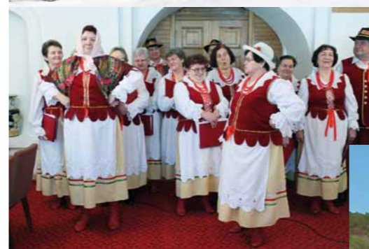
Szarotki uświetniły jubileusz Złotych Godów.