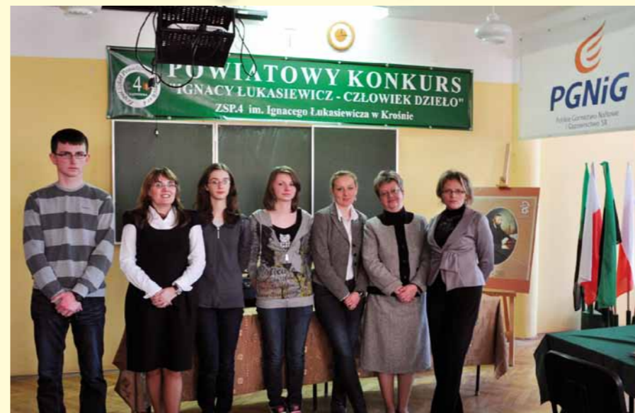
Zwycięzcy VI Powiatowego konkursu.