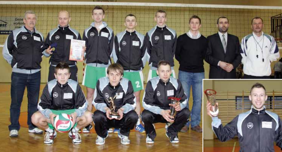
Zwycięcy Turnieju o Puchar Burmistrza SKS Dukla I