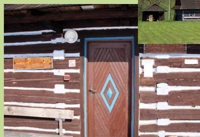
Wejście do chyży.