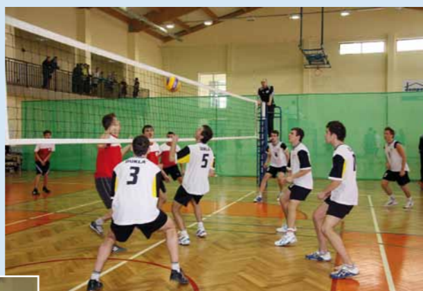
Mecz o 3. miejsce.