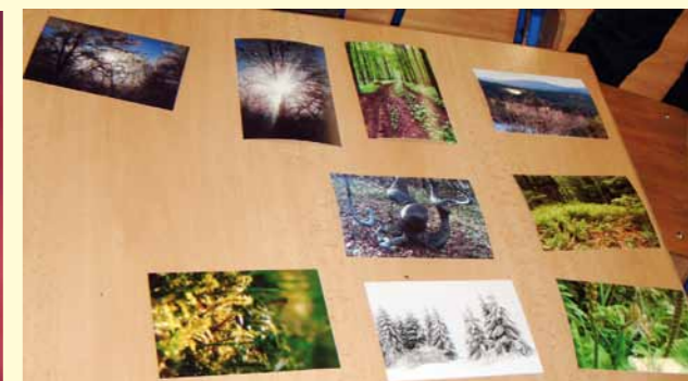
Najlepsze zdjęcia z konkursu „Las”.