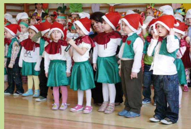
Krasnale, Biedronki, Smerfy, Motylki i Słoneczka.