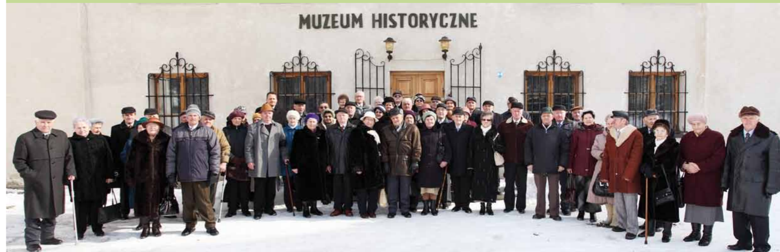
Jubilaci pod muzeum w Dukli.