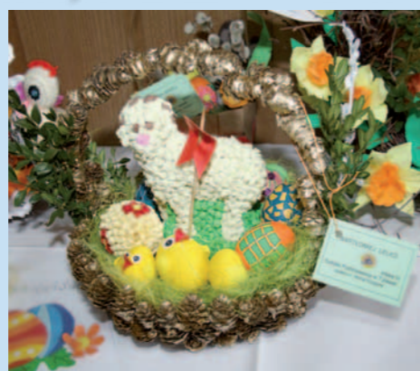
Bartłomiej Lelko (SP Tylawa) - 1. m. kat. koszyk wielkanocny