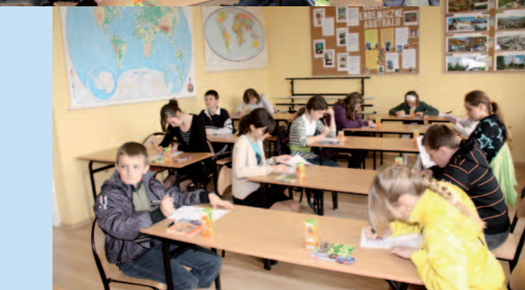
Uczniowie szkół podstawowych