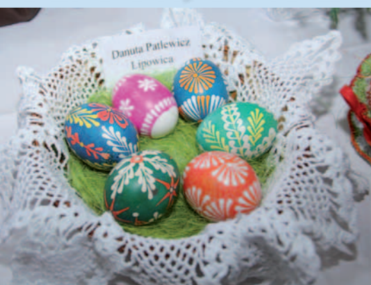
Danuta Patlewicz (Lipowica) - 1. m. kat. pisanka