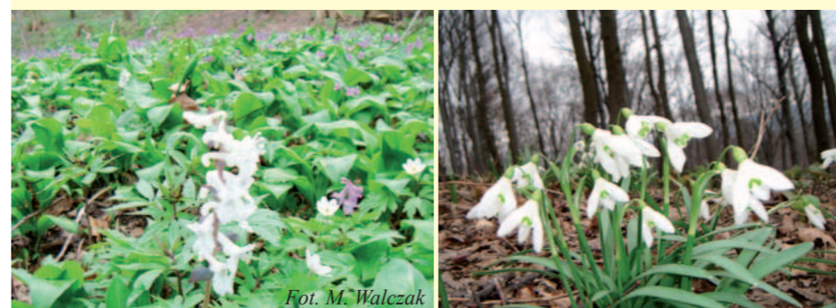
Kokorycz pusta i pełna, zawilec gajowy, w tle żywiec gruczołowaty.