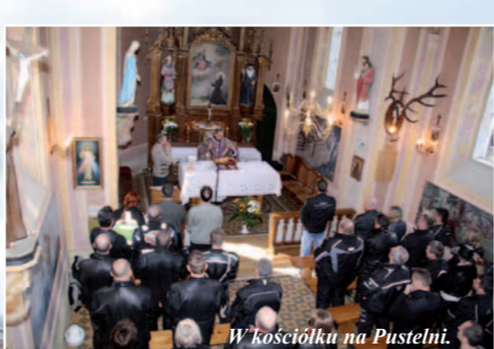
W kościółku na Pustelni.