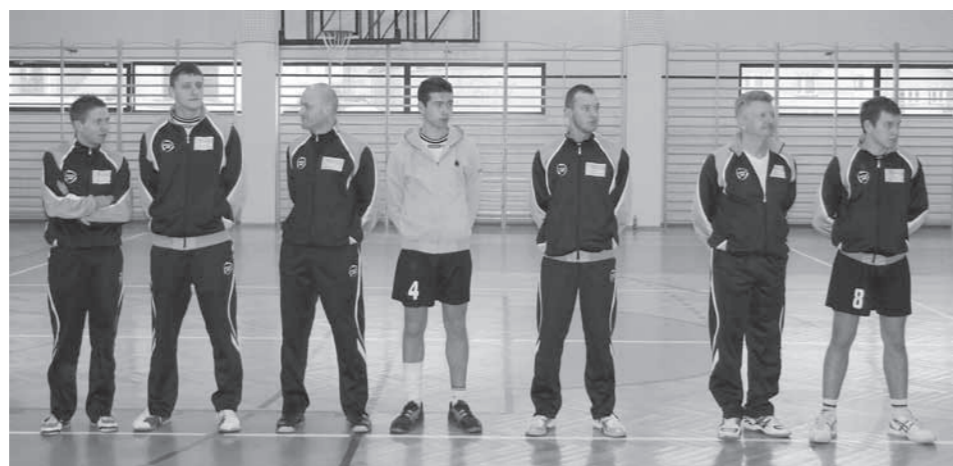
Drużyna SKS Dukla.