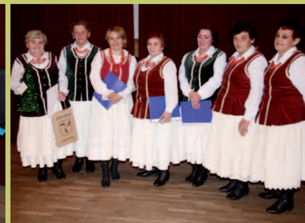
Zespół śpiewaczy z Odrzykonii.