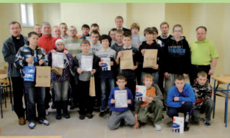
Uczestnicy Turnieju Szachowego.