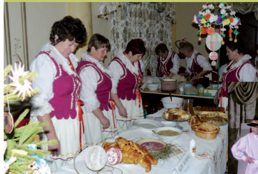
Zespół „Równianie” przy wigilijnym stole.