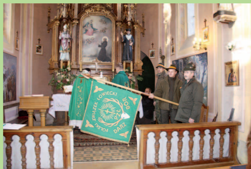
Myśliwi z sztandarem podczas mszy św. hubertowskiej 3.XII.2011 na Pustelni św. Jana z Dukli.