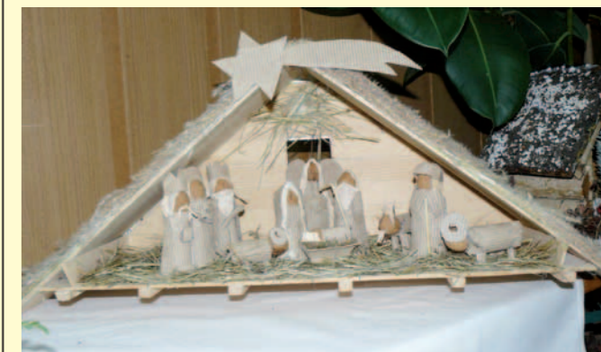
Julita Wrzecionko - 1. miejsce w kat. szopka.