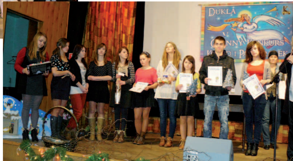
Nagrodzeni wykonawcy - kat. IV i V