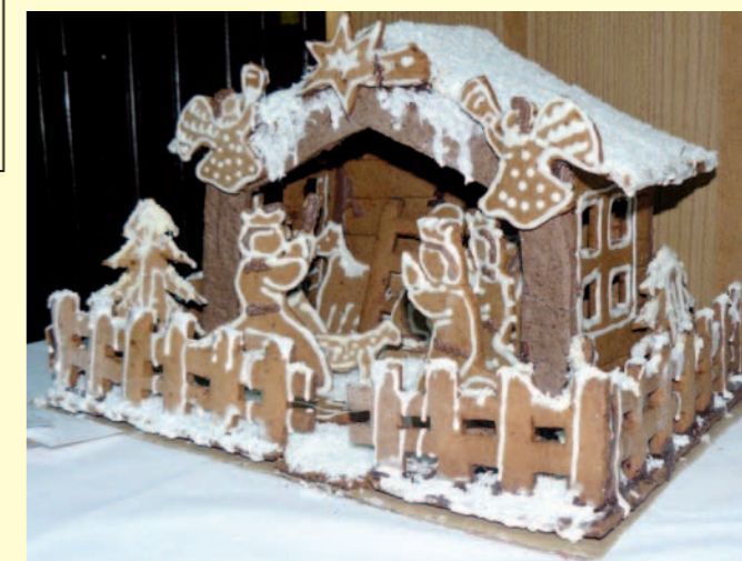
Karolina Szczurek - 1. miejsce w kat. szopka.