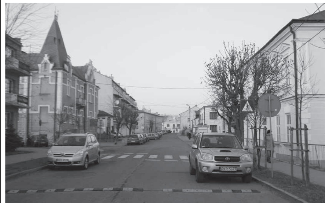
Dukla - ul. Kościuszki - 2011 r.

Myśliwskiej Braci i wszystkim innym Czytelnikom, przyjaciółom polskiego łowiectwa, a zwłaszcza Kącika Łowieckiego w Dukli.pl Zarząd Koła Łowieckiego „Rogacz” w Dukli życzy wszelkiej pomyślności, szczęścia i zdrowia w Nowym 2012 Roku.