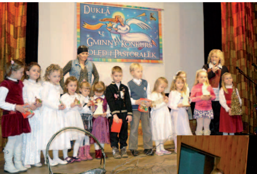
Nagrodzeni wykonawcy - kat. I