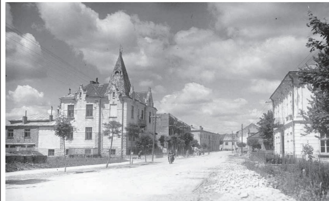
Dukla - ul. Kościuszki z 1960 r.