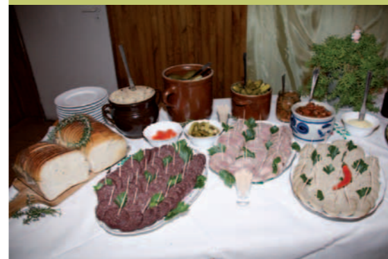
Stół z jadłem regionalnym.