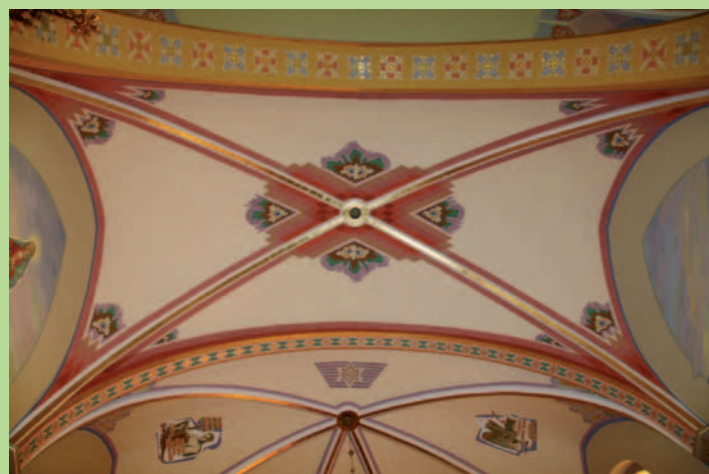
Polichromia na suficie i ścianach po renowacji.