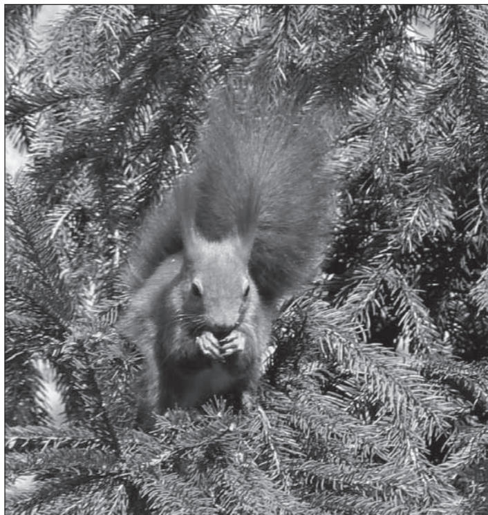
Wiewiórka pospolita.

Wiewiórka zamieszkuje lasy wszelkich typów, parki miejskie i inne większe zadrzewienia. Żyje samotnie, łącząc się w pary tylko na czas rui. Każdy osobnik posiada własne terytorium. Jest to gatunek aktywny w dzień. Zimą nie zapada w sen, ale szczególnie niekorzystną pogodę przeczekuje w kryjówek, którymi są dziuple lub gniazda w kształcie kuli, zbudowane z gałązek i wyściełane mchem i porostami. Doskonale wspina się po gałęziach i przeskakuje z drzewa na drzewo.