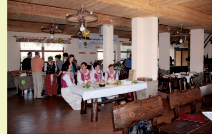
Konferencja odbyła się w Gościńcu Chyrowianka