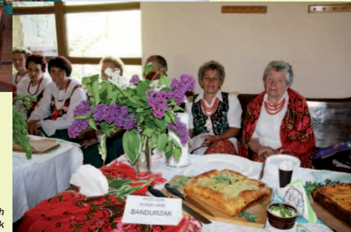
KGW z Łęk Dukielskich przygotowało bandurzak