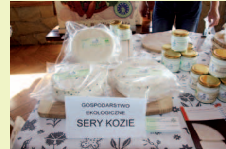
Sery kozie z gospodarstwa ekologicznego z Mszany