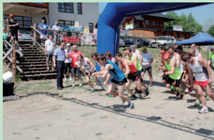
Na starcie biegu mężczyzn