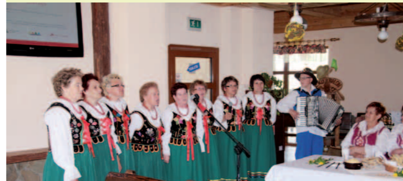
Zespół Wietrzniarki wystąpił w części artystycznej konferencji