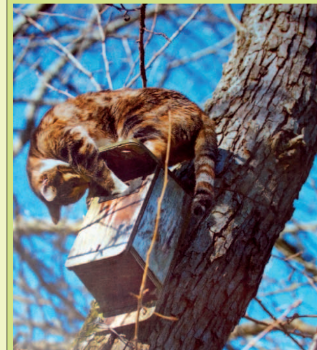
Ulubieniec Zosi - kot Pa...kot.

Publikujemy zdjęcia ulubionych czworonogów Czytelników Dukli.pl. Zachęcamy do wysyłania zdjęć Państwa pupilów.