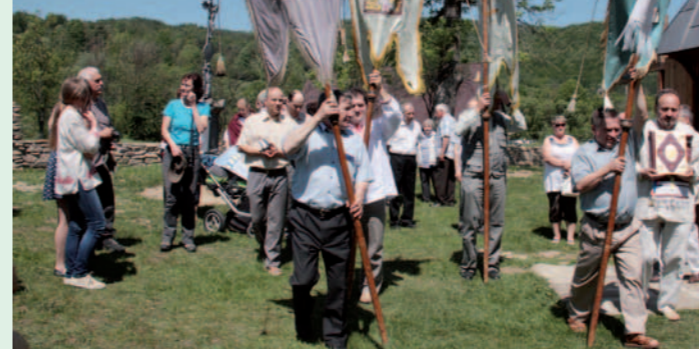
Procesja podczas nabożeństwa