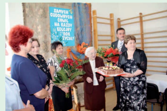
Był tort, kwiaty i życzenia

Redakcja Dukli.pl/DPS Dukla, 9 maja 2013 roku