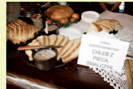
Chleb i mazurki chyrowskie (smalczyk) miały powode