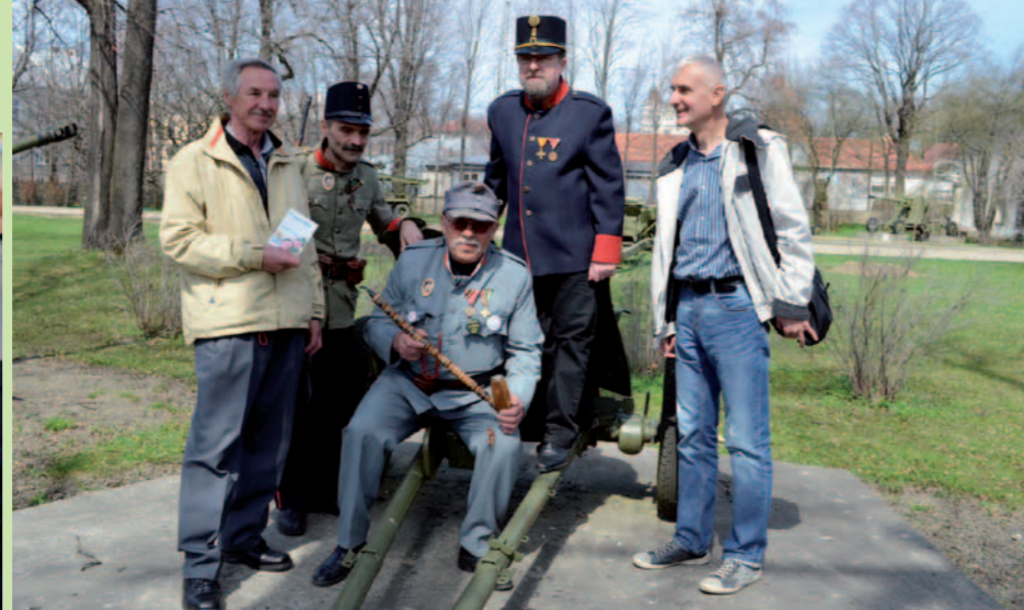
Pamiętkowe zdjęcie na dziedzińcu dukielskiego Pałacu