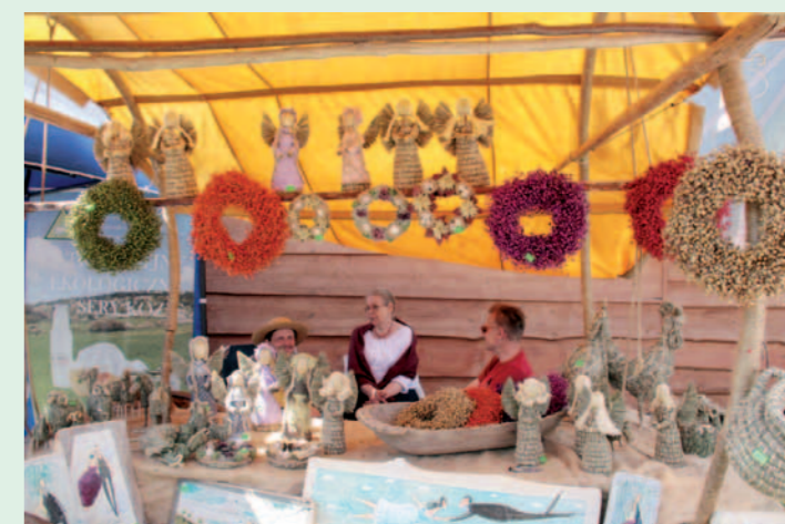
Nie zabrakło także rękodzieła i smakotyków