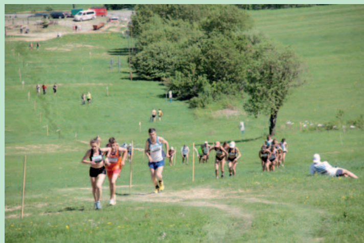
Morderczy podbieg na Danie