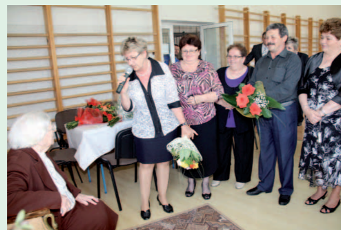
Kolejka składających życzenia była długa