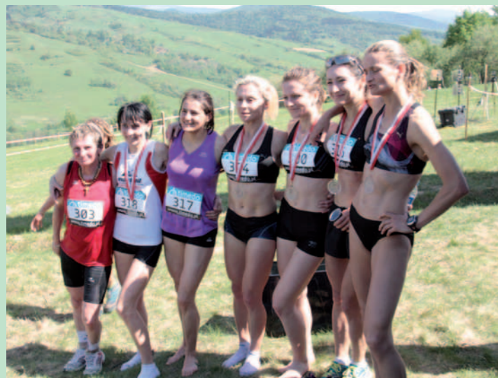
Siedem najszybszych w górach kobiet w Polsce