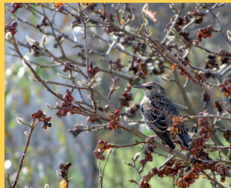
Fot: Stanisław Lis „Szpak szuka nasion na magnolii”