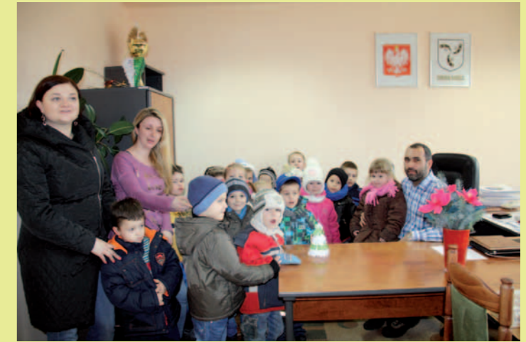
U p. wiceburmistrza Andrzeja Bytnara