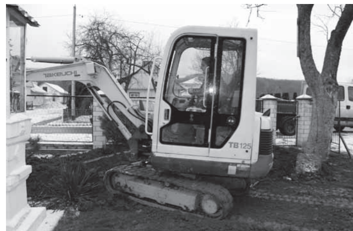
Zima pozwalała na prace ziemne