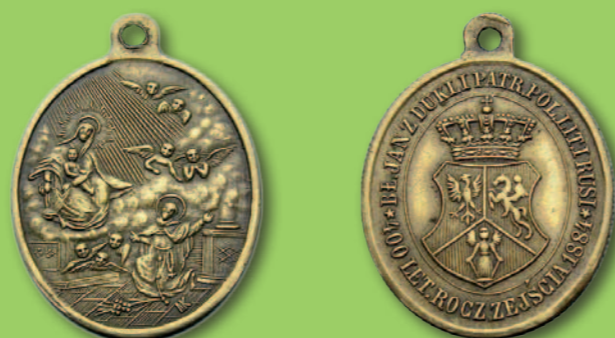
Awers i rewers medalika wybitego w 1884 roku z okazji 400 lecia śmierci bł. Jana z Dukli, Patrona Polski, Litwy i Rusi.