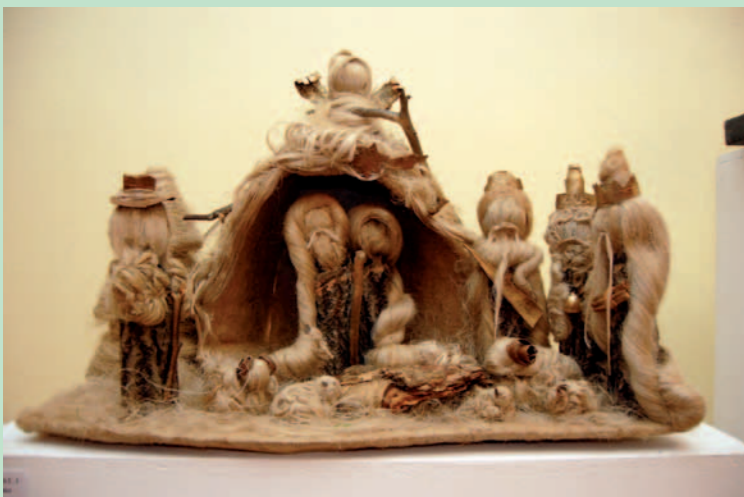
I miejsce (kat. I) - Jowita Wrzecionko, ZS nr 1 w Dukli