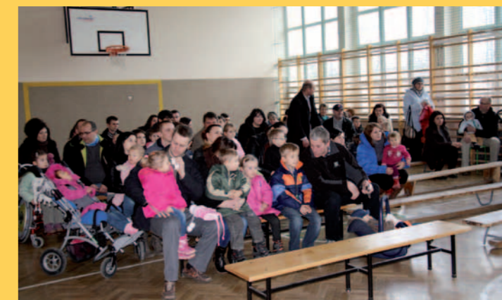
Pacjenci Revity z rodzeństwem i rodzicami