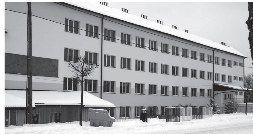
ZS nr 1 w Dukli