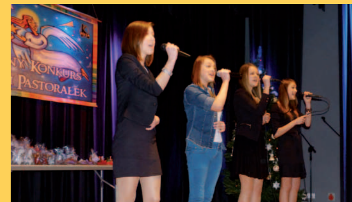
Zespół ze szkoły z Łęk Dukielskich - I miejsce