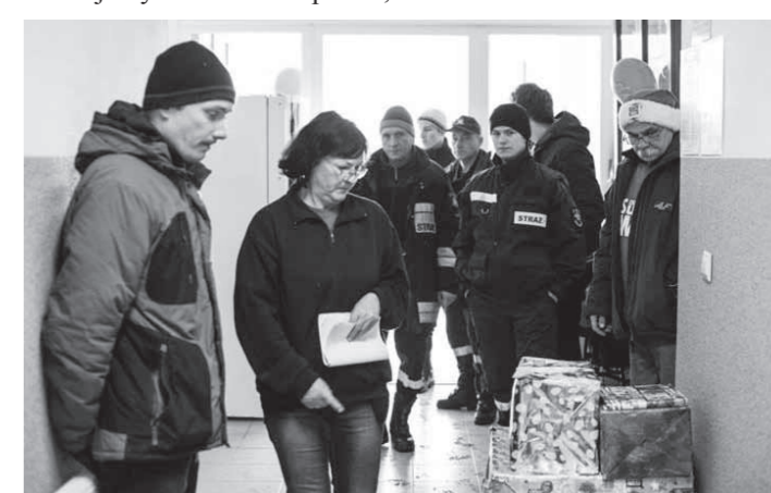
Wolontariusze przy pracy