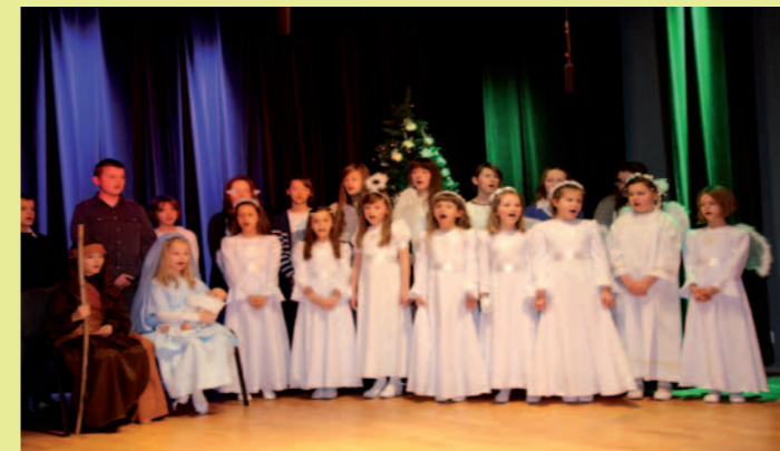
Dzeci z Zespołu Szkół nr 1 w Dukli