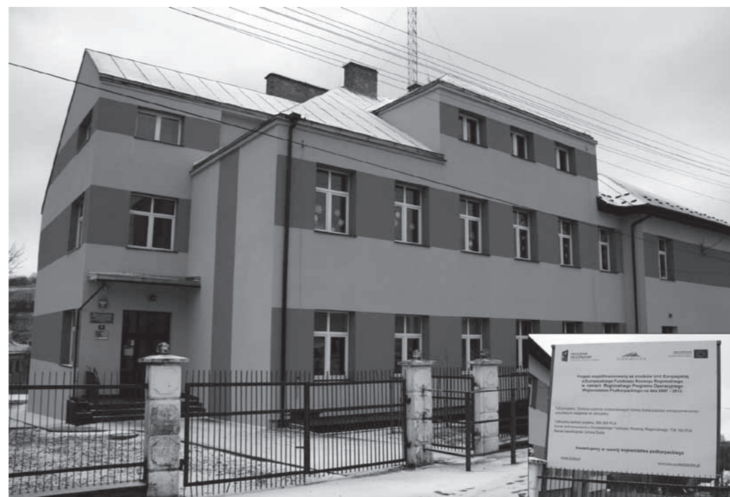
ZSP w Równem