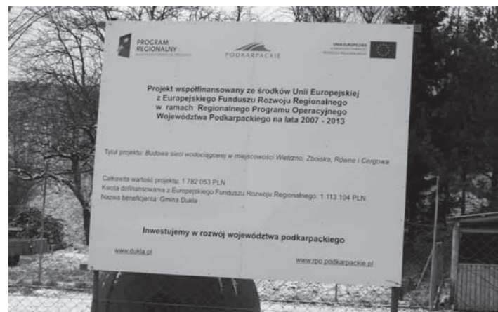
Tablica informacyjna przy DL w Zboiskach