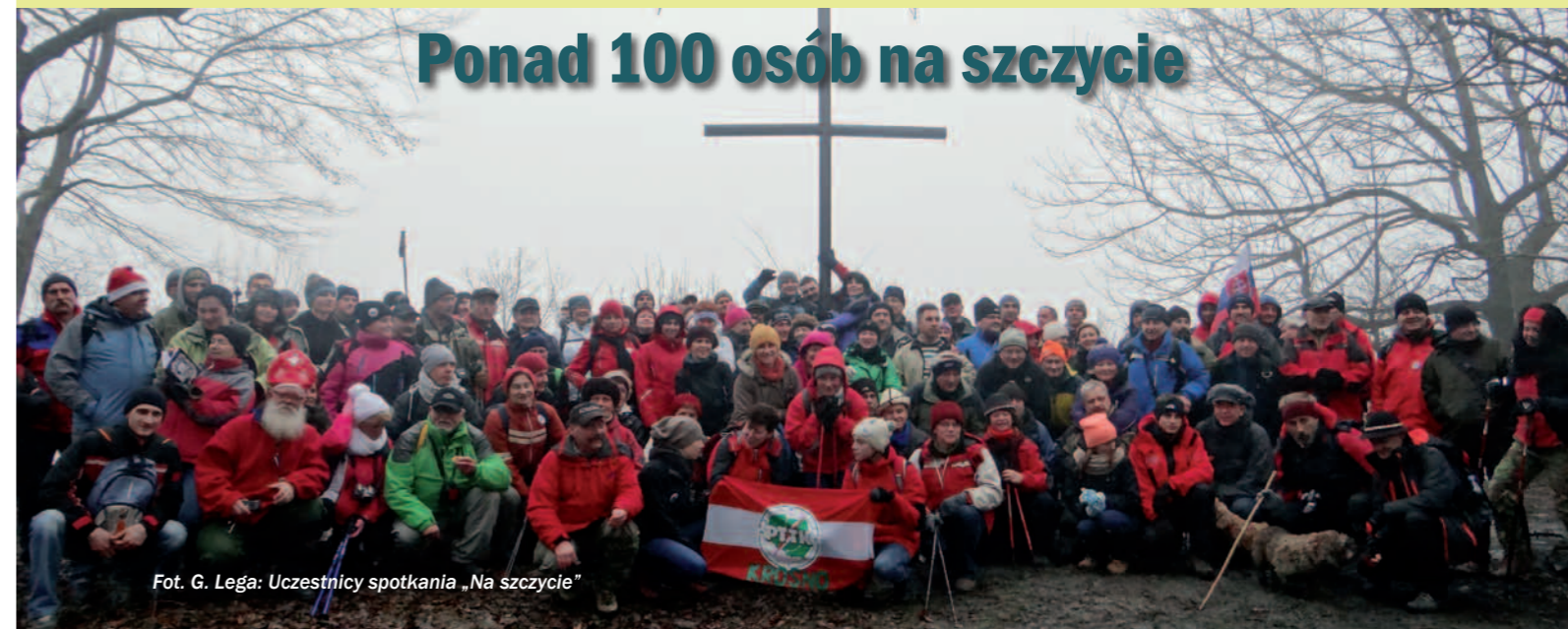
Uczestnicy spotkania „Na szczycie”