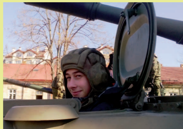
Uczniowie przymierzali hełmy i kombinezony, mogli wejść do wozu bojowego.