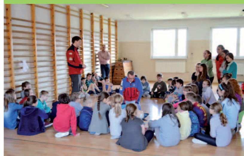
Pracownicy GOPR prowadzą zajęcia z PPP