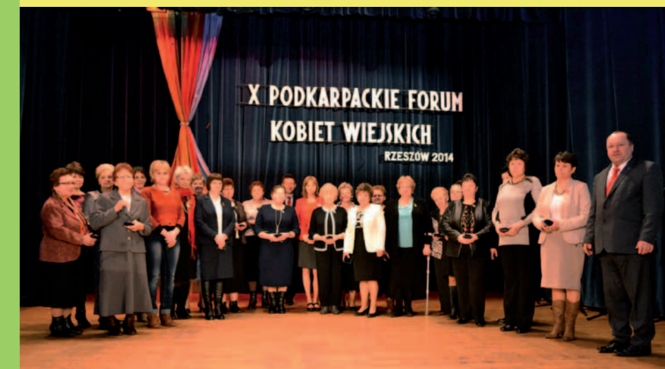
Odnaczone Medalem św. Izydora Oracza kobiety na X Podkarpackim Forum Kobiety Wiejskich