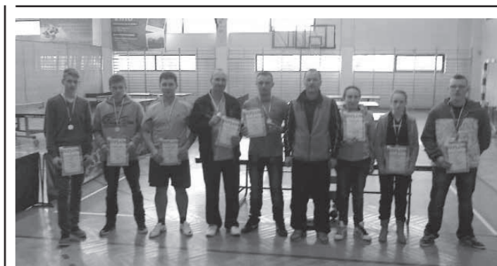
Zwycięzcy zawodnicy z organizatorami