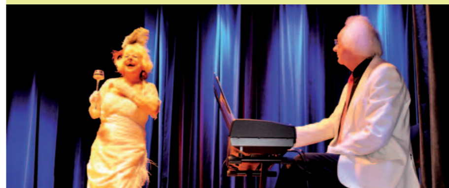
Artyści scen lubelskich w OK w Dukli