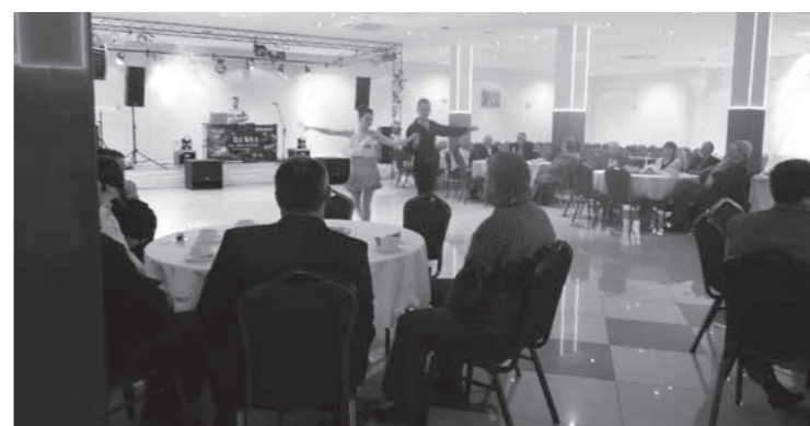
Sołtysi na spotkaniu w restauracji ZIKO

nych przez organizacje imprezach cyklicznych: np. Kermesz w Olchowcu, Spotkania Folklorystyczne w Łękach Dukielskich „Ocalić od zapomnienia”, Od Rusal do Jana w Zydranowej i wielu innych imprezach.