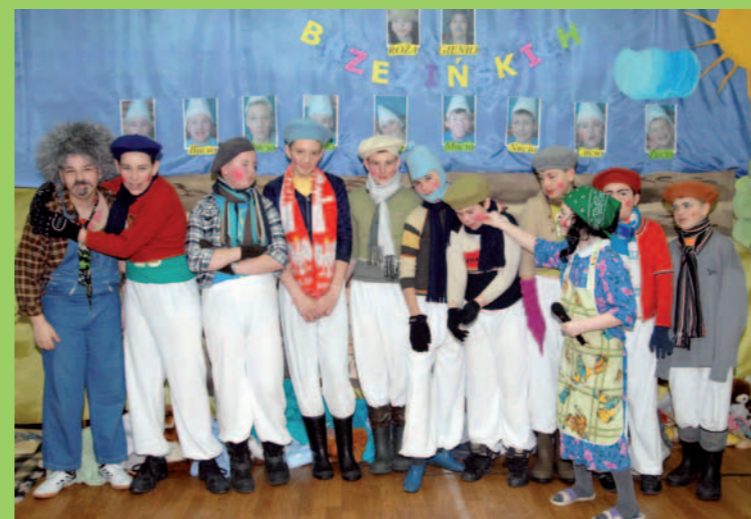
Koło teatralne „Klakier” przygotowało część artystyczną