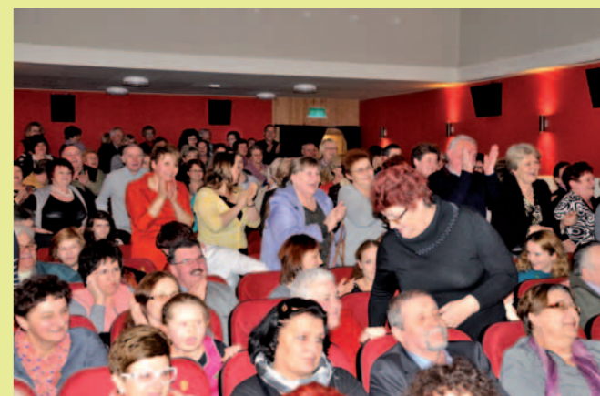
Na koncercie sala była wypełniona po brzegi