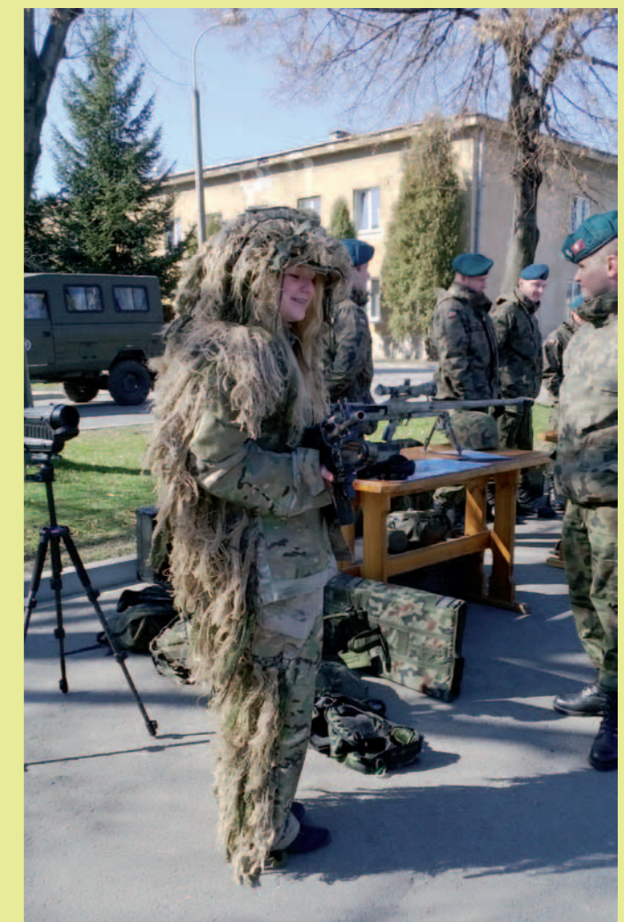
W kombinezonie maskującym strzelca lub obserwatora

z zadań 21 BSP jest min. przygotowanie i udział w misjach pokojowych, humanitarnych i stabilizacyjnych. Podhalańczycy brali udział w operacjach w Albanii, Kosowie, Iraku i obecnie w Afganistanie.