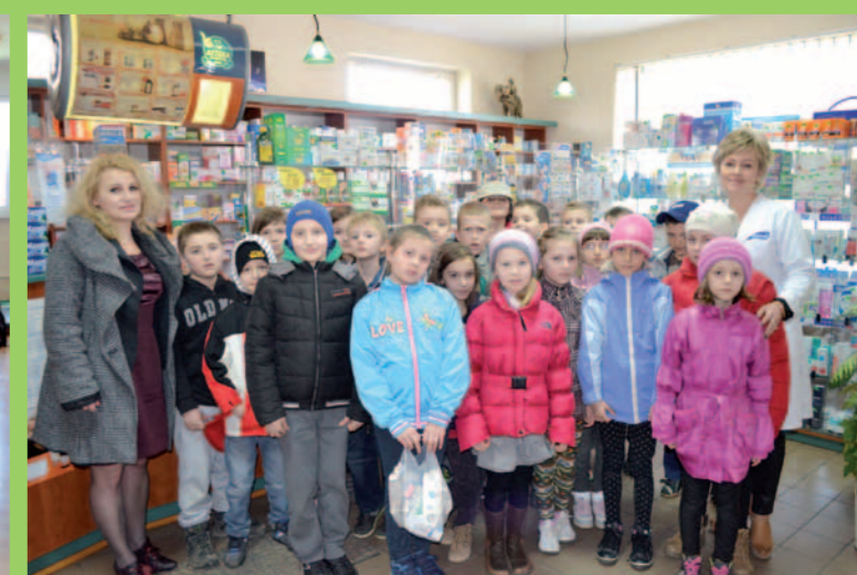
Klasa III b w aptece „Urtika”