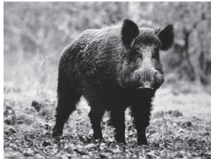
Uwaga, uwaga! Dzik. Walka z A. S. F.: Dzikie nie uznają granic, z Białorusi przeniosły się na Litwę.

Przytoczę dopracowane i poprawione prawo PZŁ i polski model łowiectwa. Prawo łowieckie zostało znowelizowane przez sejm i podpisane przez