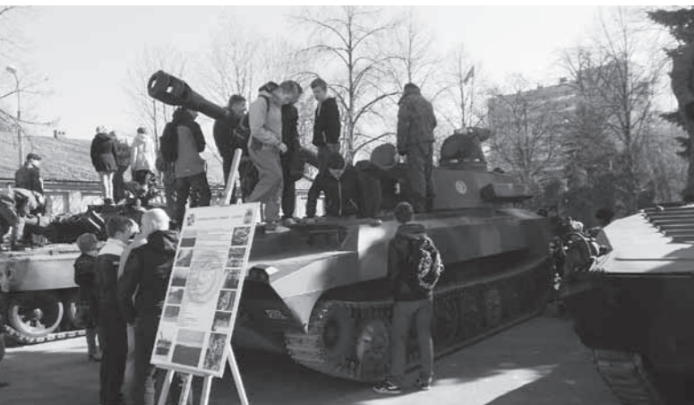
Uczniowie z zainteresowaniem oglądają pojazdy bojowe.