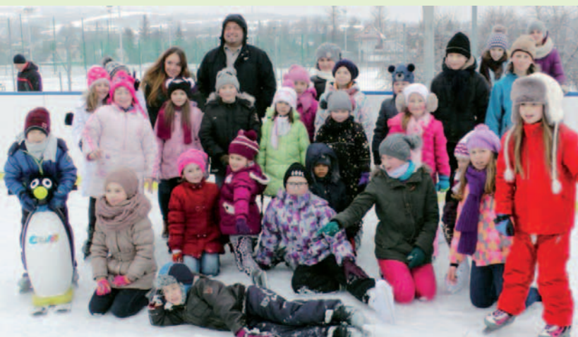
Frekwencja zawsze dopisywała