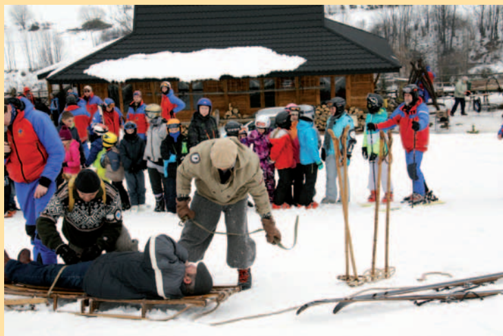
Pokaz ratownictwa - tak ratowano poszkodowanych w pierwszej połowie XX w.