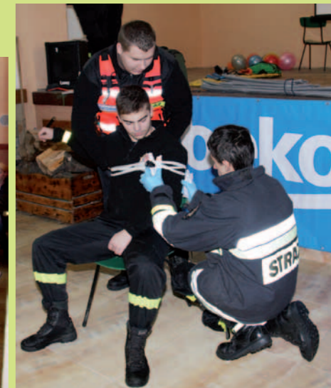
Pokaz unieruchamiania kończyn w wykonaniu strażaków z OSP Dukla