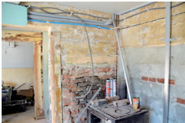
W domu wymieniono wszystkie instalacje.

czyli się też uczniowie I LO im. Mikołaja Kopernika w Krośnie.