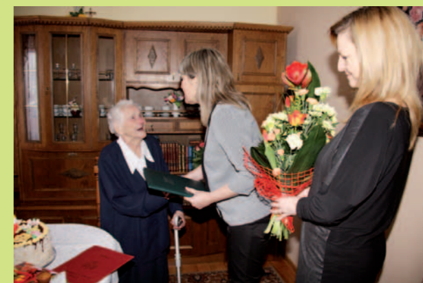
Gratulacje i kwiaty od pań z Inspektoratu ZUS w Krośnie