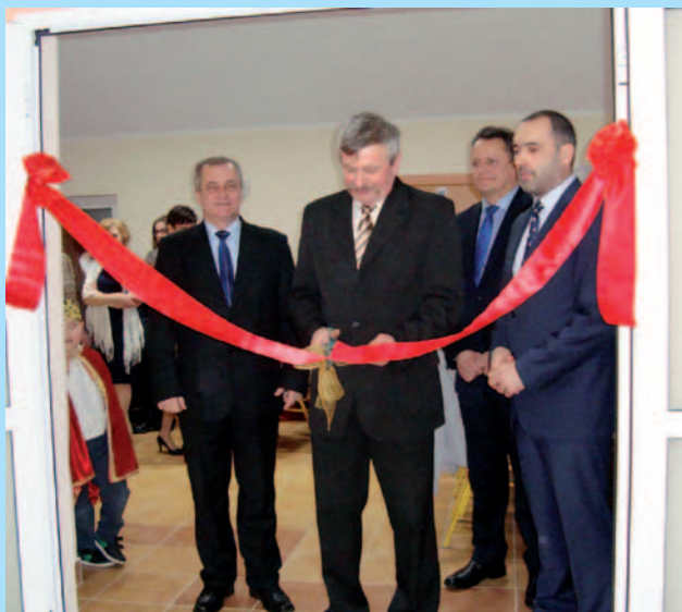
Uroczyste przecięcie wstęgi