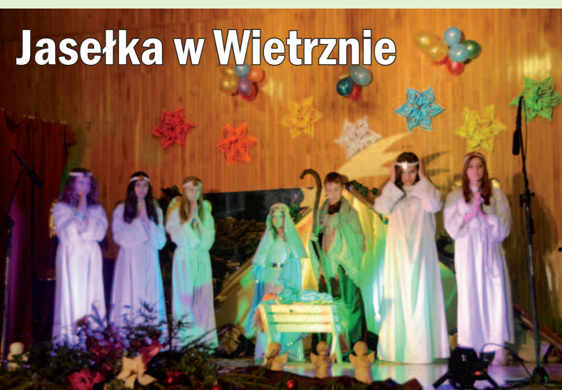
Inscenizację jasełek wykonały dzieci z SP w Wietrznie