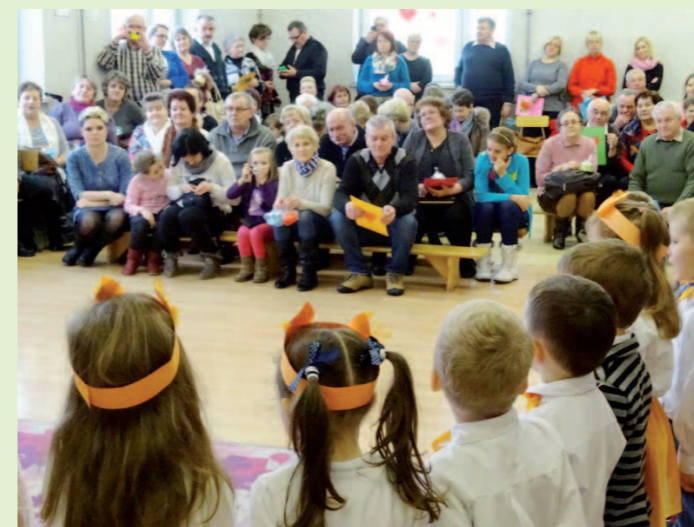
Na uroczystości w przedszkolu