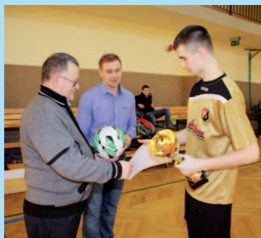
Kapitan drużyny Guzikówka - zwycięzca memoriału odbiera dyplom i nagrody