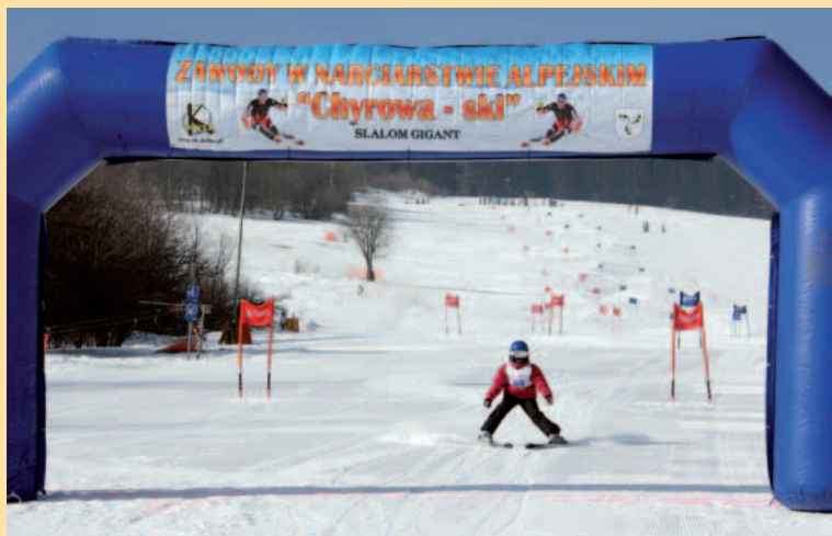
Już na mecie