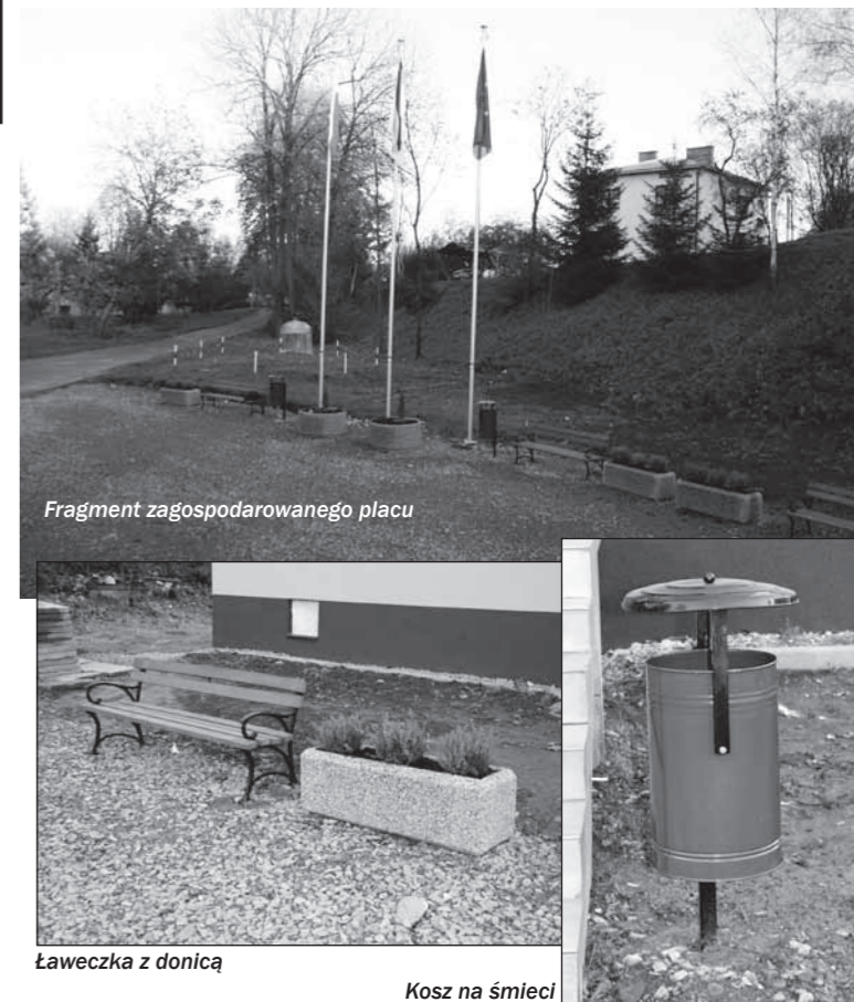
Fragment zagospodarowanego placu