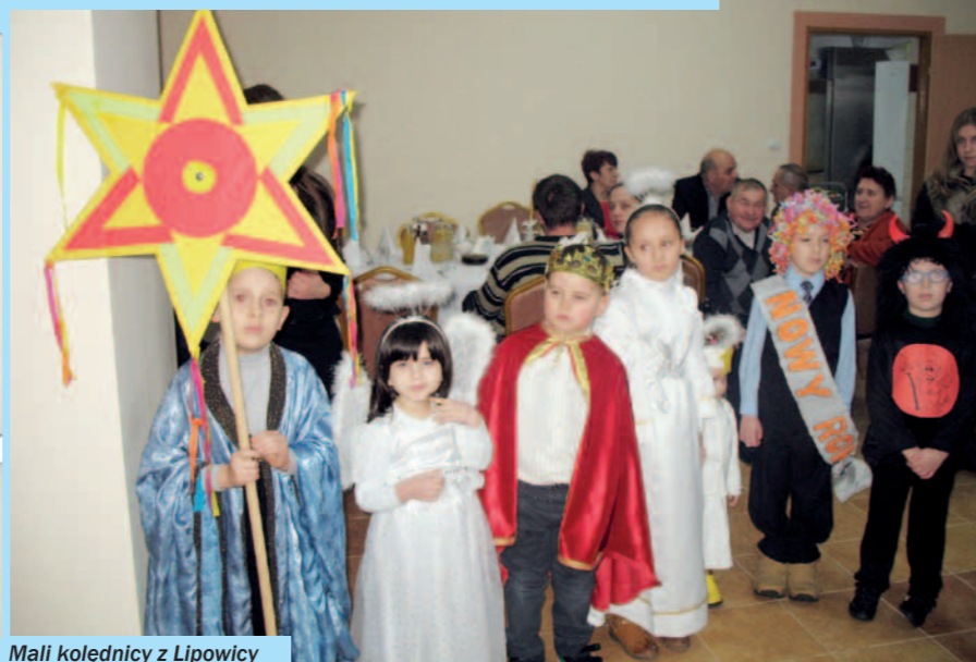
Mali kolednicy z Lipowicy