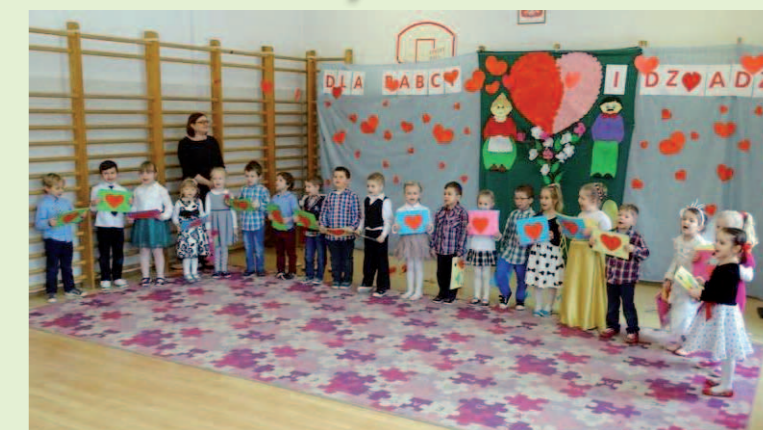
Inscenizacja przygotowana przez przedszkolaki dla dziadków