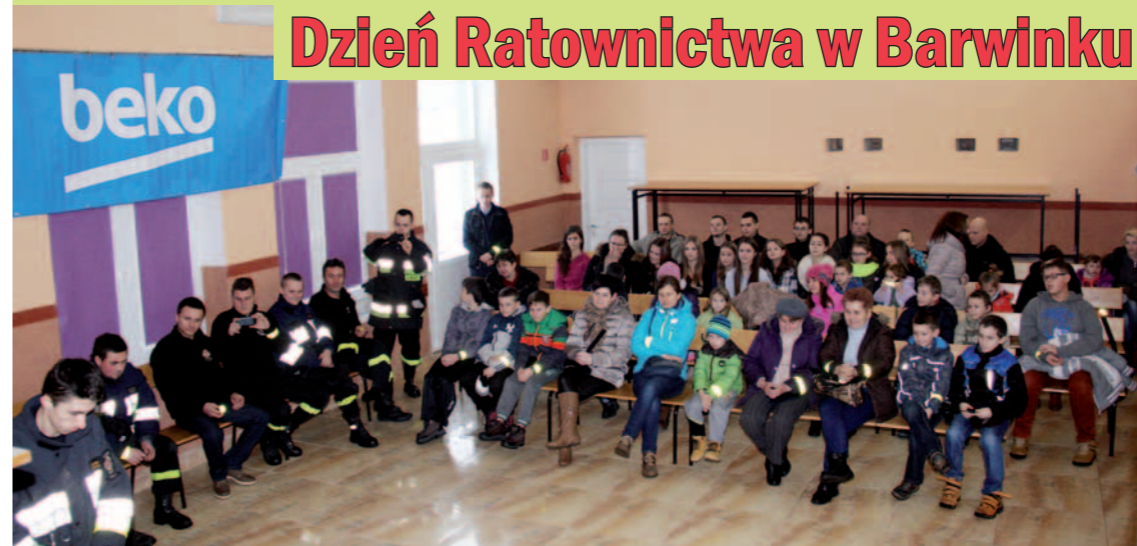
Uczestnicy spotkania „Bezpieczne ferie”