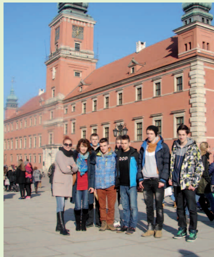
Uczestnicy wyjazdu z opiekunkami przy Zamku Królewskim.