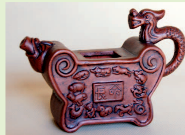
Chiński czajnik do parzenia herbaty