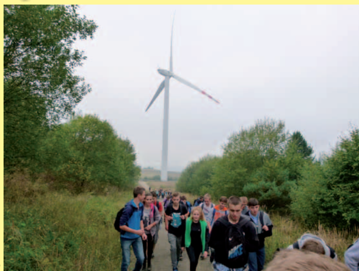
W Górach Świętokrzyskich