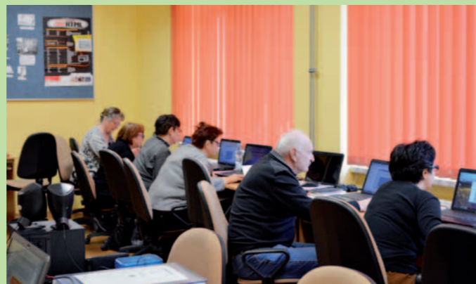
Zainteresowanie zajęciami z Informatyki było bardzo duże