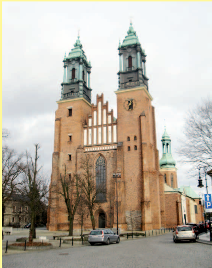
Bazylika Archikatedralna św. Apostołów Piotra i Pawła w Poznaniu - jeden z najstarszych polskich kościołów i najstarsza polska katedra (968 rok)