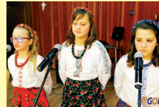
Zespół Tereściacy z Zawadki Rymanowskiej i Mszany