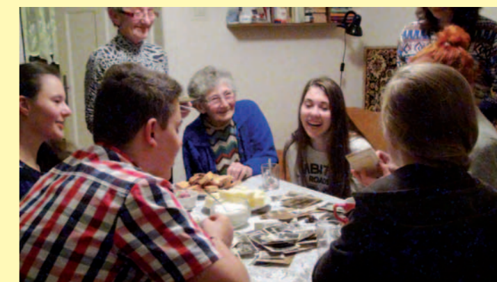
W trakcie rozmowy z uczniami i nauczycielkami