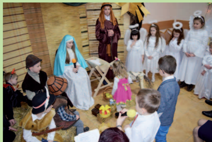
Jasełka w wykonaniu dzieci z Lipowicy