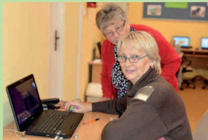
Podczas zajęć z informatyki