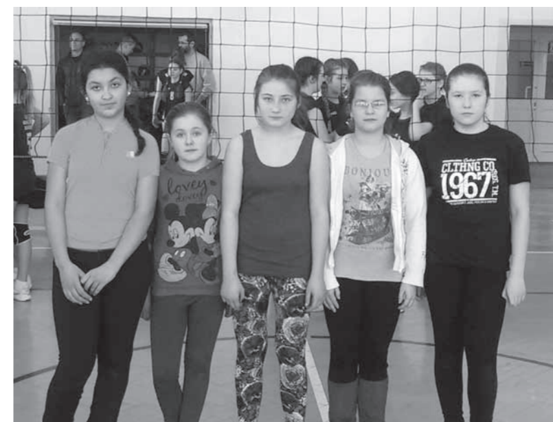
Zawodniczki dukielskie z rocznika 2003 podczas turnieju Kinder Sport