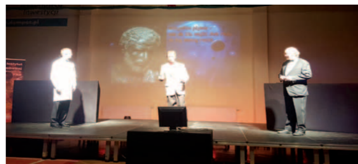
Naukowcy podczas pokazów w ZS nr 2 w Dukli

Urodził się w 1957 r. w Mrzygłodzie, na Ziemi Sanockiej, a jego tato jest Duklaninem. W latach 1972-1976 uczęszczał do Liceum Ogólnokształcącego w Dukli, a od roku 1976 studiował fizykę na Wydziale Matematyczno-Fizyczno-Chemicznym Uniwersytetu Jagiellońskiego w Krakowie. Podczas nauki w Liceum Ogólnokształcącym w Dukli brał udział w zawodach Olimpiady Astronomicznej, zdobywając dwukrotnie (w latach 1975 i 1976) tytuł laureata w finale ogólnopolskim. Studia ukończył w 1981 r. i wtedy też został zatrudniony w Instytucie Fizyki Jądrowej w Krakowie, gdzie pracuje do dziś. Jego specjalność to fizyka struktury jądra atomowego. Stopień doktora uzyskał