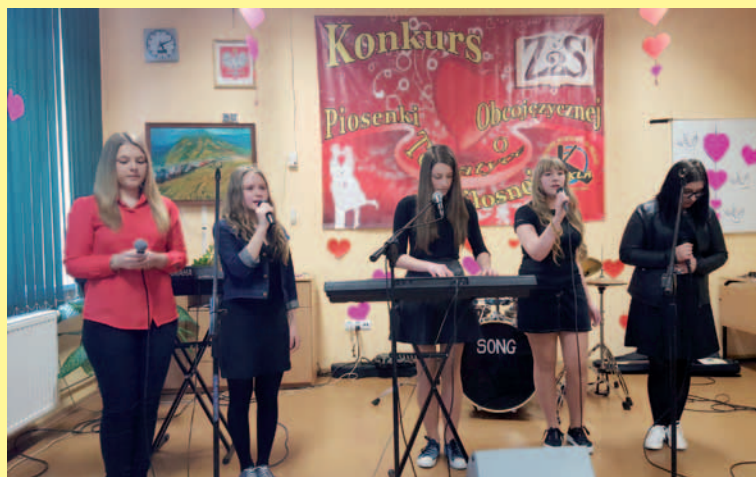
Zespół z ZS nr 2 w Dukli zajął 2 miejsce