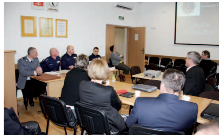
Podczas prezentacji Mapy zagrożeń bezpieczeństwa w powiecie krośnieńskim