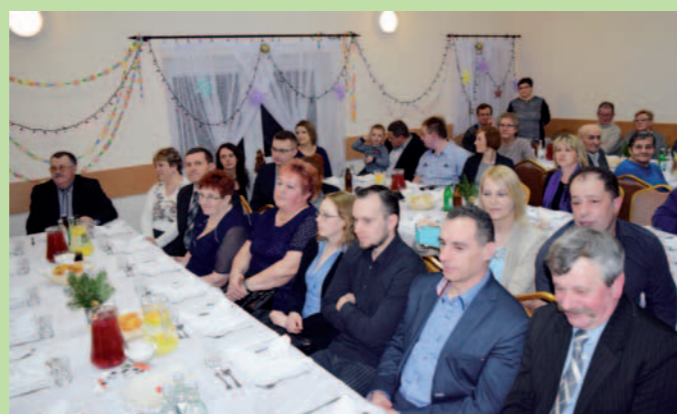
Oplątkowy poczęstunek przygotowany przez członkinie Stowarzyszenia Liposka