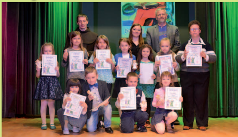
Laureaci Konkursu Piosenki Religijnej