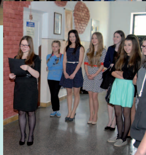
Odsłonięcie ściany wspomnień.