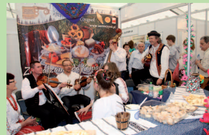
Zespół „Tereściacy” na stoisku Śląskiego Urzędu Marszałkowskiego