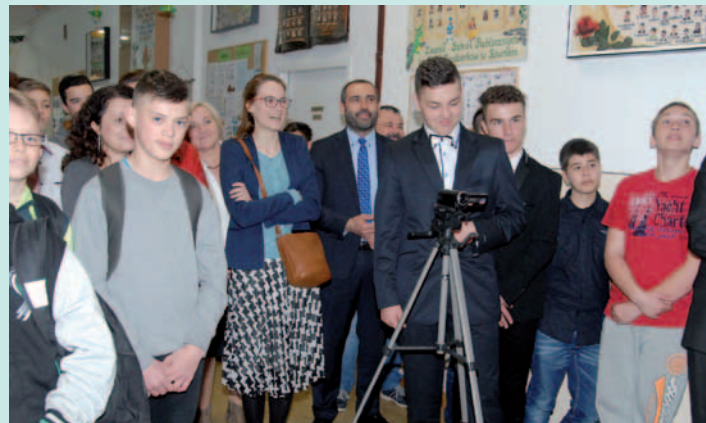
Uczniowie i zaproszeni goście podczas prezentacji projektów