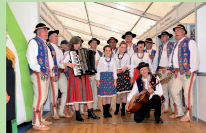
Wspólne śpiewanie z flisakami