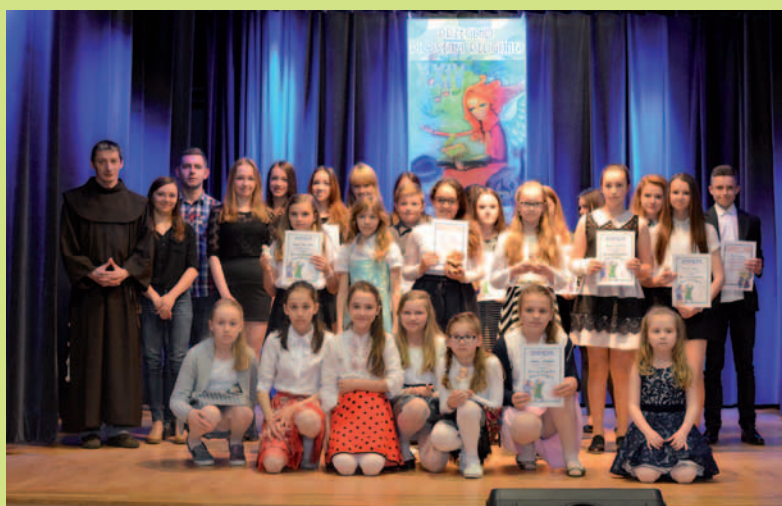
Nagrodzeni w kat. III i IV