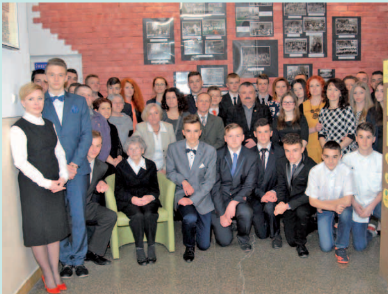
Wspólne zdjęcie uczestników podsumowania