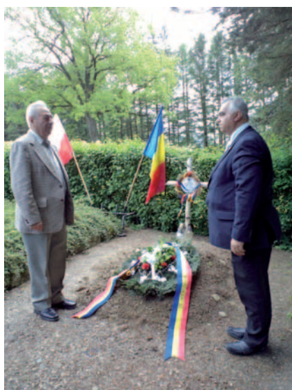
Delegacja rumuńska złożyła wieniec na grobie swojego rodaka