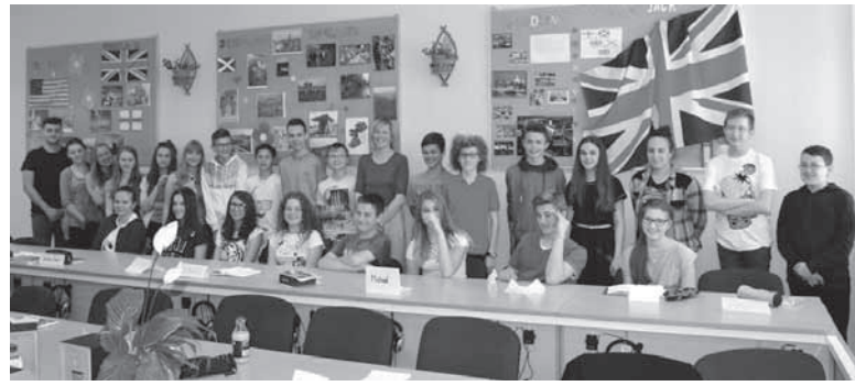
Wspólne zdjęcie gości, nauczycieli i uczniów z klasy językowej w dukielskim gimnazjum