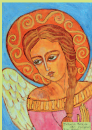
Praca Jadwigi Bożacz - wyróżnienie - kat. dorośli