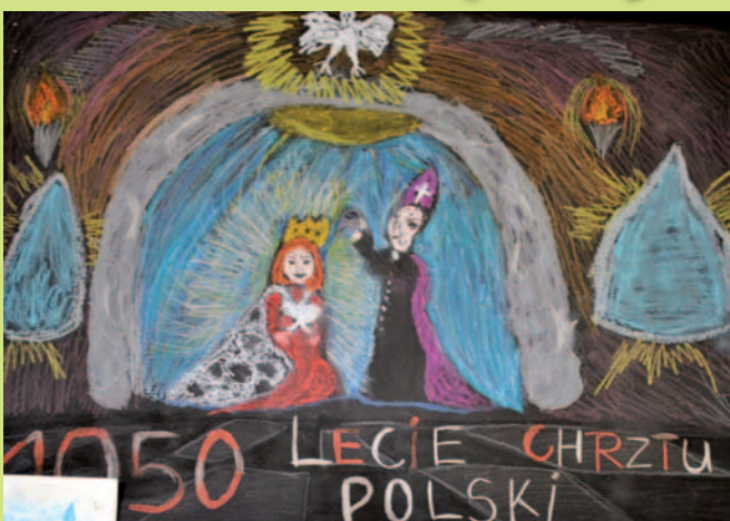
Prace zwycięzców Konkursu Plastycznego