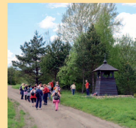
Odpooczynek przy kapliczce