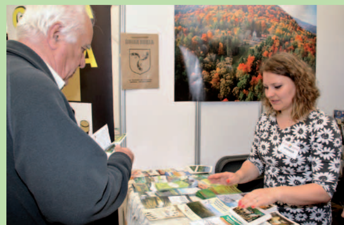
Odwiedzający stoisko gminy Dukla otrzymywali wyczerpujące informacje