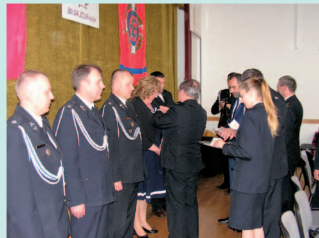
Odnaczeni Medalami za Zasługi dla Pożarnictwa