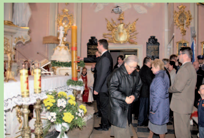
Uczestnicy Mszy św. Jubileuszowej odnowili przyrzeczenia chrzcielne