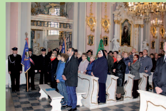
Uczestnicy mszy św. jubileuszowej podczas nabożeństwa