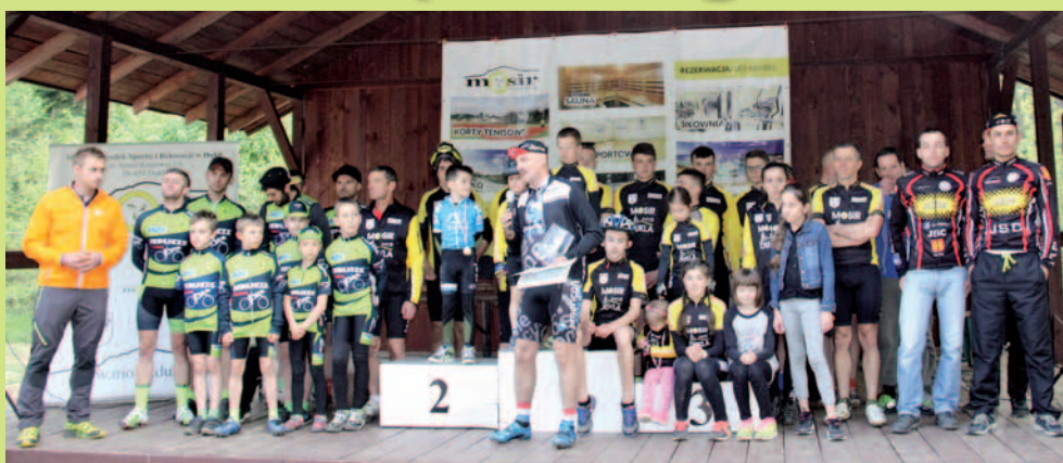
Uczestnicy zawodów rowerowych XC w skansenie, w Bóbrce