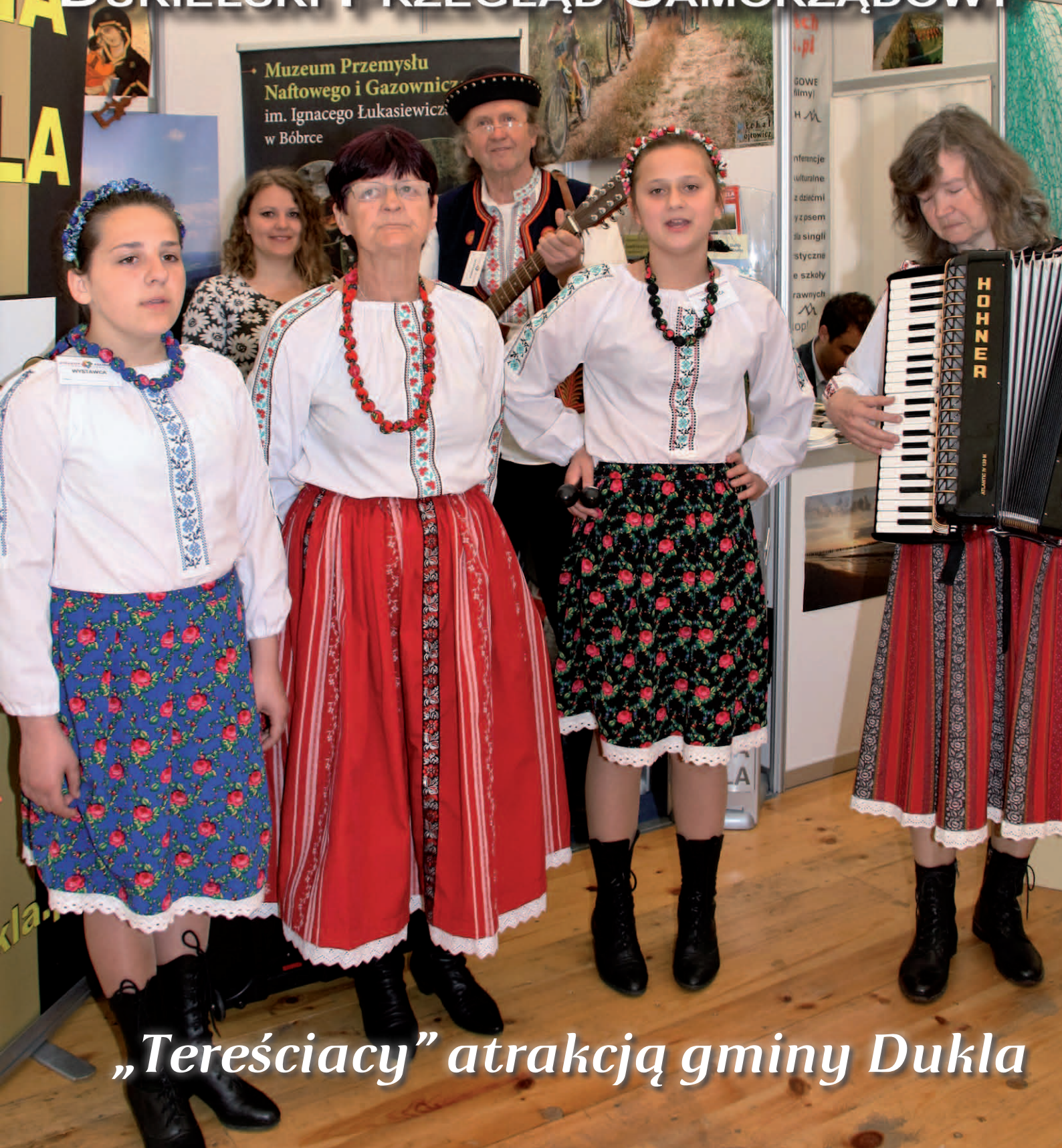
„Tereściacy” atrakcją gminy Dukla