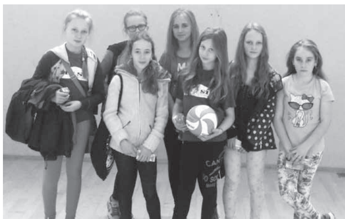
Dukielskie zawodniczeki sekcji siatkowej MOSiR Dukla