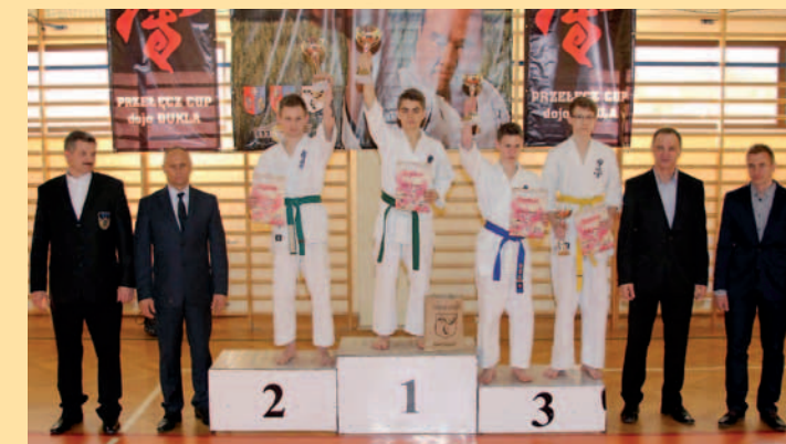
Organizatorzy ze zwycięzcami