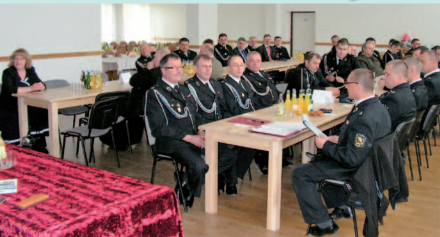
X Zjazd Oddziału Gminnego OSP RP w Dukli odbył się w Iwli