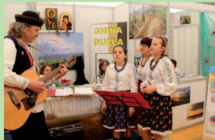
Zespół „Tereściacy” przed stoiskiem gminy Dukla