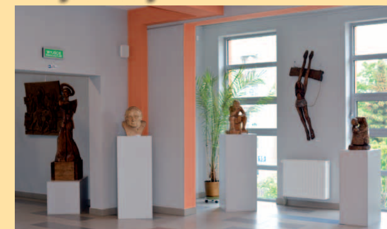
Wystawa uczniów Liceum Plastycznego w Krośnie