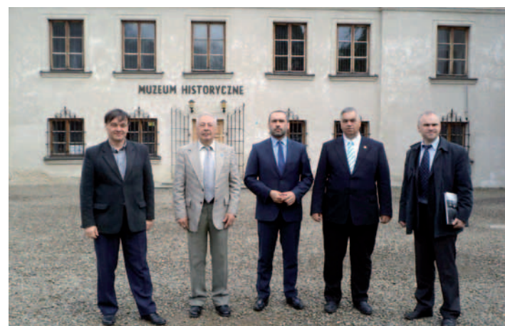
Przed Muzeum Historycznym-Pałac w Dukli