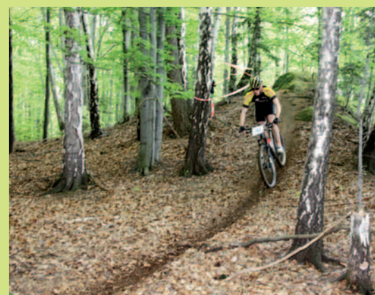
Trasa była atrakcyjna i trudna