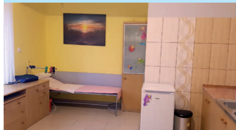
Gabinet zabiegowy w Ośrodku Zdrowia w Równem