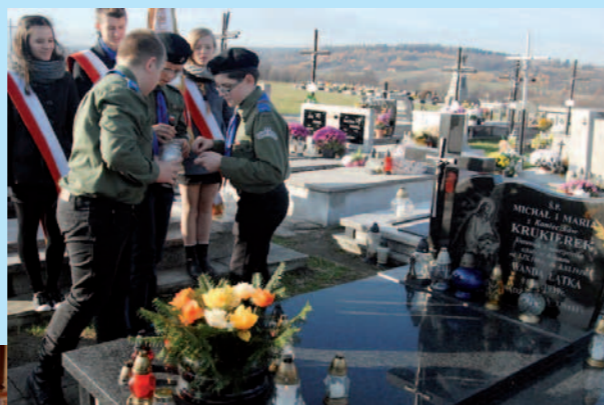
Podczas Święta Patronów Szkoły