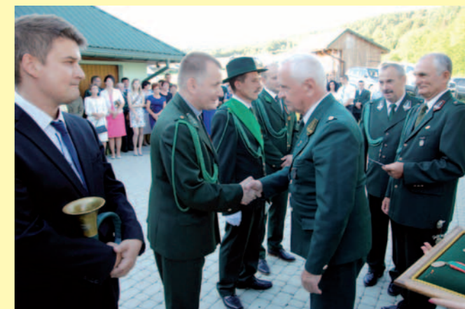
Jubileusz był okazją do wręczenia myśliwym odznaczeń

Myśliwi z Kola Łowieckiego „Rogacz” w drodze do kościoła na uroczystą mszę św. w okazji Jubileuszu 70. lecia