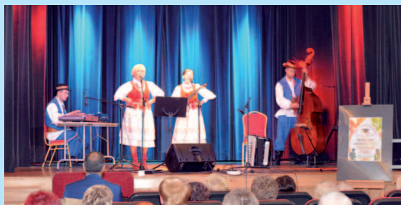
Występ artystyczny kapeli Duklanie