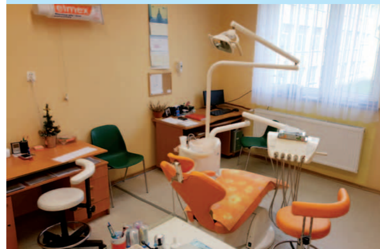
Gabinet stomatologiczny w ZS nr 1 w Dukli