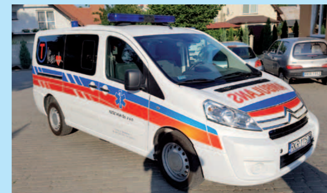
Karetką pogotowia NZOZ VIVA Dukla