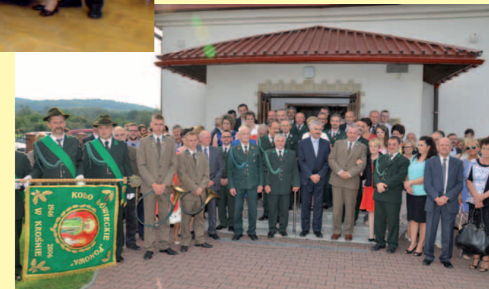
Uczestnicy Jubileuszu 70. lecia Kł „Ponowa”