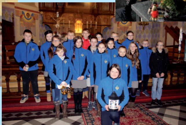
Betlejemskie Światło Pokoju Równe