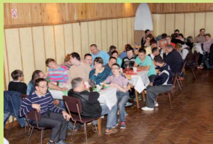
Na spotkaniu w Domu Ludowym w Cergowej