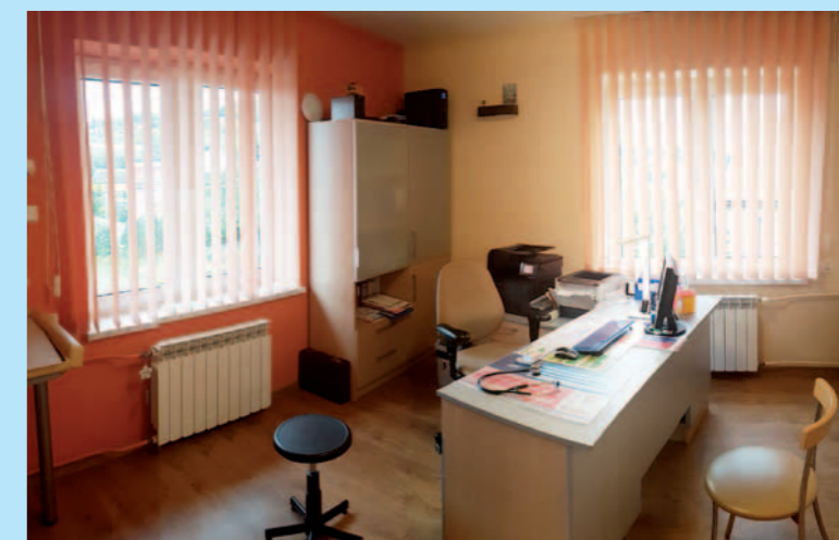
Gabinet lekarski w Równem