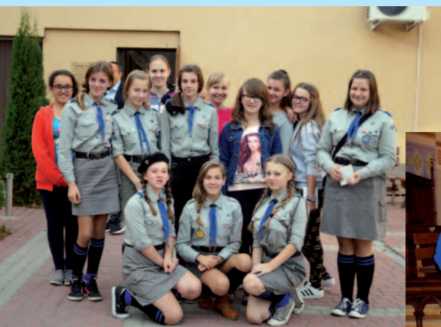
14 DH z Równego z uczennicami z Jasionki