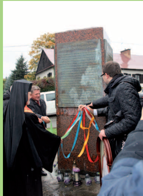
Odsłonięcie tablicy upamiętniającej Ukraińców biorących udział w operacji dukielsko-preszowskiej