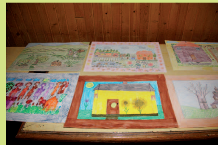
Prace plastyczne wykonane podczas warsztatów przez uczestników ŚDS