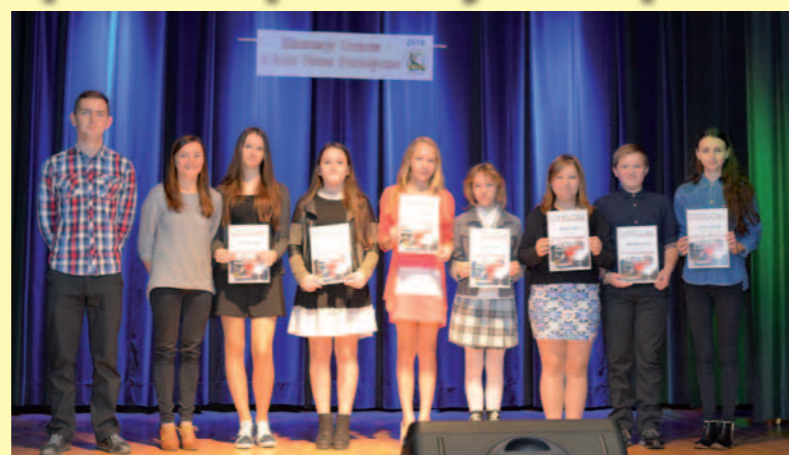
Nominowani do konkursu powiatowego