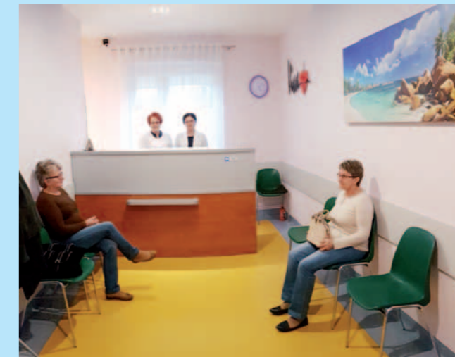
Rejestracja w Iwli