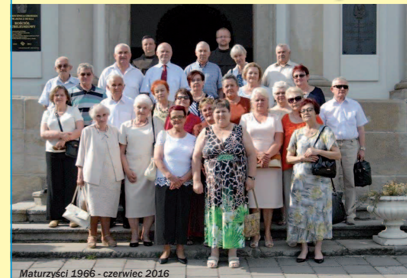
Maturzyści 1966 - czerwiec 2016