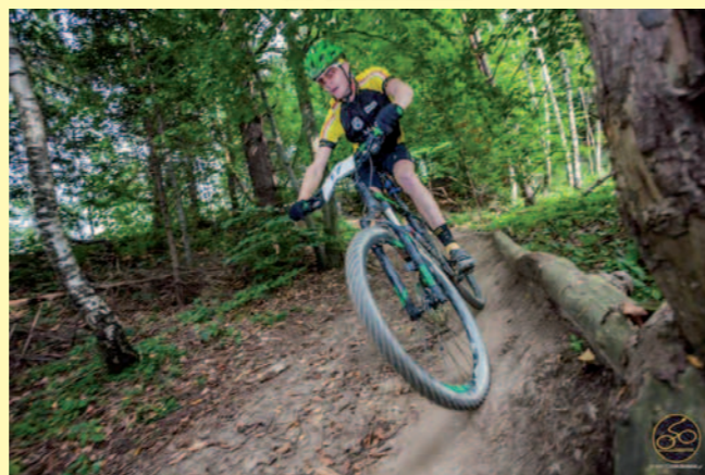
Nie było łatwo - zmagania zawodników na trasie w Szczawnicy i Wierchomli