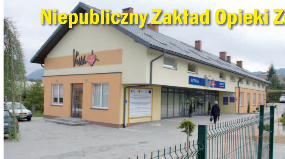
Budynek główny w Dukli