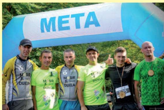
Uczestnicy biegu z sekcji MOSiR Dukla