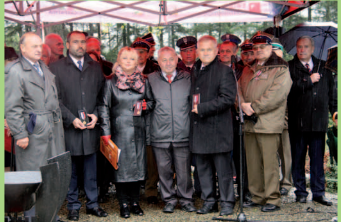
Deszcz nie przeszkodził w uroczystościach rocznicowych. Na pierwszym planie odznaczeni przez Związek Kombatanów Słowackich