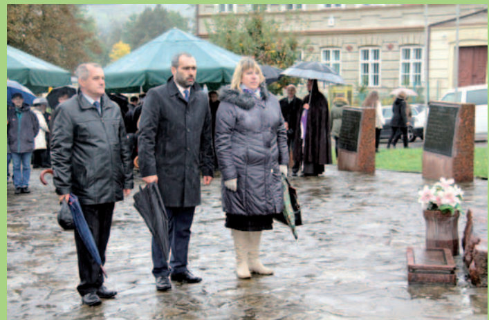
Składanie kwiatów pod Krzyżem Pojednania.