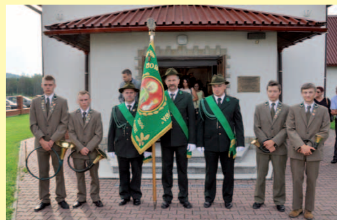
Poczet sztandarowy Kł „Ponowa”