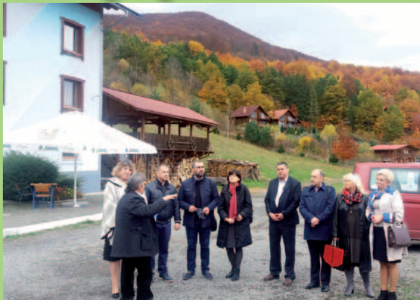
Z wizytą w klubie Vission w miejscowości Kostrimo