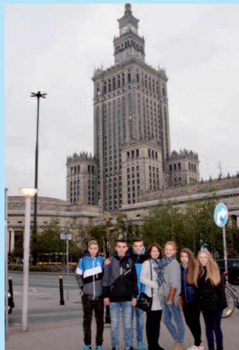
Uczestnicy wyjazdu pod Pałacem Kultury