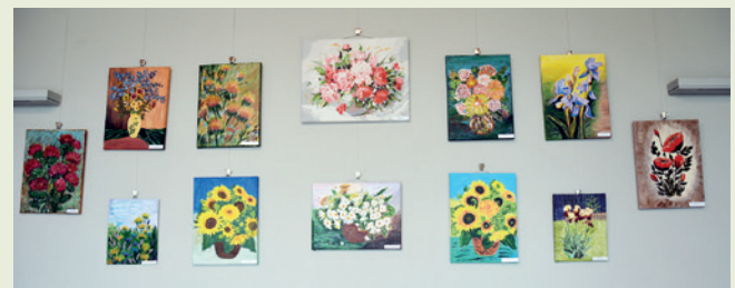
Fragment wystawy - obrazy