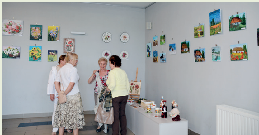
Fragment wystawy z uczestniczkami otwarcia