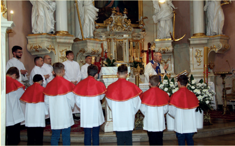
Msza św. za Ojczyznę w parafii pw. św. Marii Magdaleny