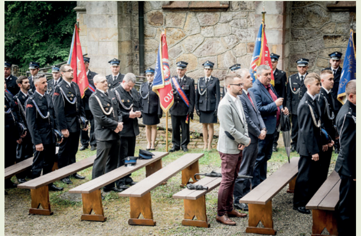
Strażacy podczas mszy św. na Pustelni św. Jana z Dukli