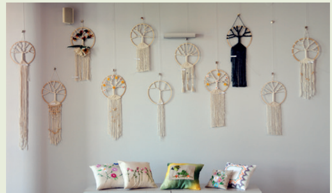
Fragment wystawy - makrama