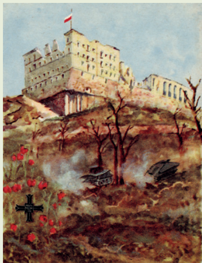
Widok zniszczonego klasztoru na Monte Cassino według kartki pocztowej wydanej w latach osiemdziesiątych XX wieku przez ZBoWiD przez Dom Słowa polskiego