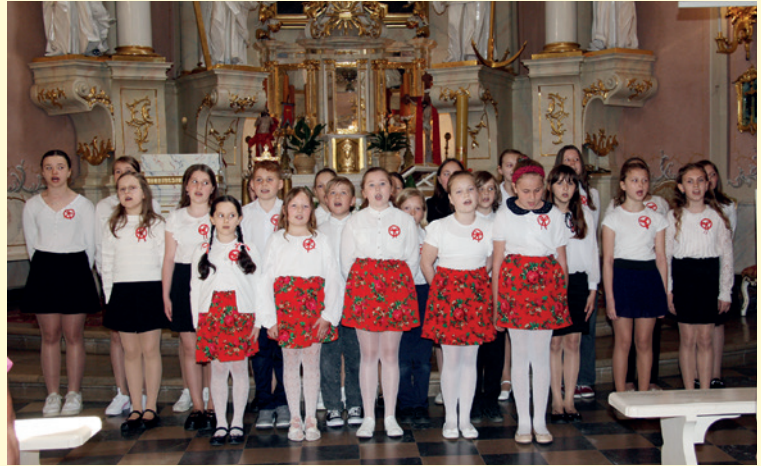
Program słowno-muzyczny w wykonaniu uczniów z SP w Dukli