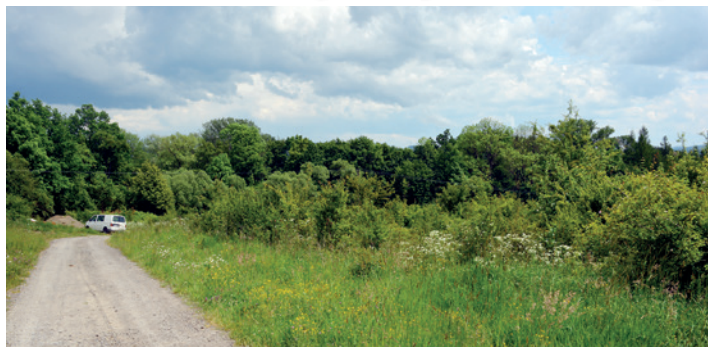
Ruszają prace na osiedlu przy ul. Kopernika w Dukli.