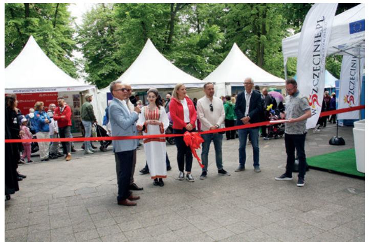
Oficjalne otwarcie targów