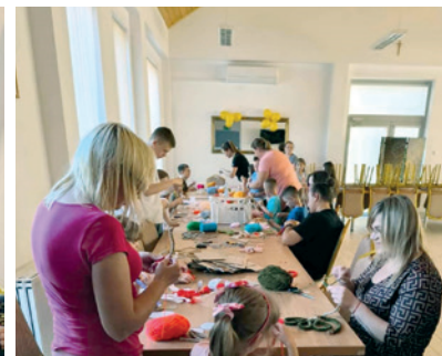
Tworzenie dzieł makramowych przez uczestników warsztatów.