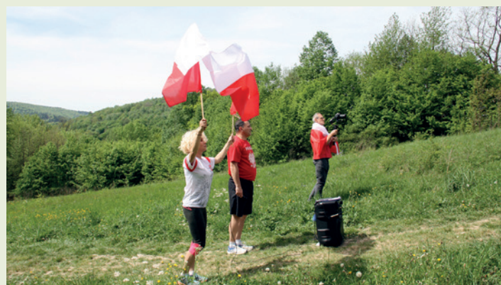
Marszbieg prowadziła wicemistrzyni świata w biegach górskich Iżabela Zatorska - Pleskacz