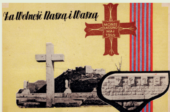
Kartka pocztowa wydana po drugiej wojnie światowej według projektu Władysława Szomańskiego i Romualda Nowickiego przez Danesi - Via Margutta Roma