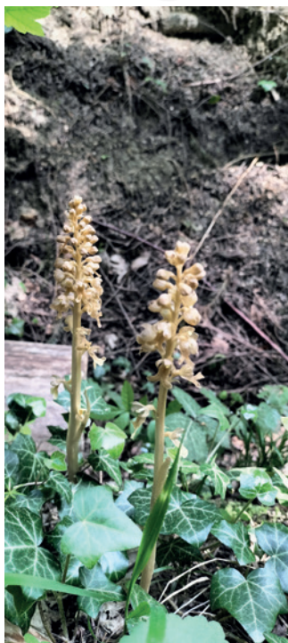
W drodze na górę Cergową spotykamy ciekawe rośliny.