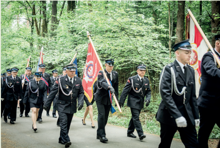
Strażacy w drodze do kościoła