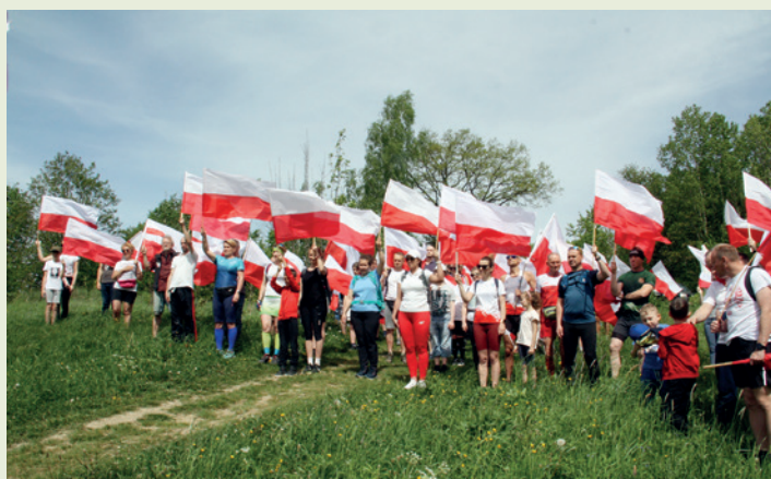
Uczestnicy marszbiegu przed startem