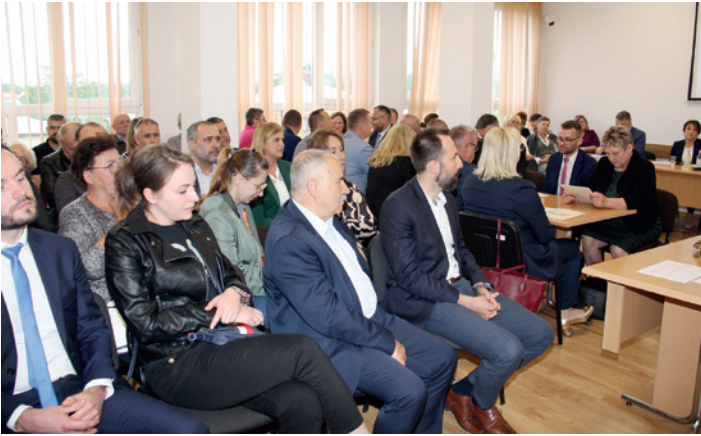
Uczestnicy I sesji RM w Dukli