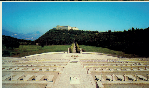
Widok Polskiego Cmentarza Wojennego na Monte Cassino według pocztówek wydanych przez miejscowe opactwo benedyktyńców