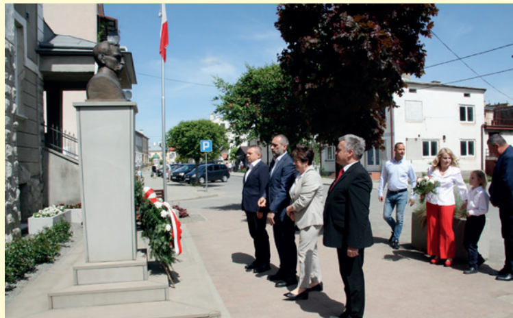
Składanie wieńca pod pomnikiem Marszałka Józefa Piłsudskiego