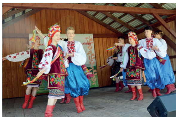
Występ zespołu Arkan z Przemyśla