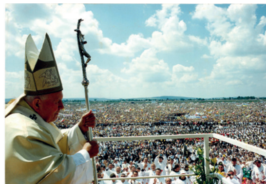
Święty Jan Paweł II - kanonizacja bł. Jana z Dukli na świętego - Krosno 10. 06. 1997