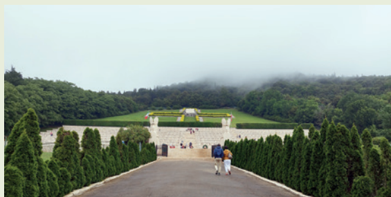
widok Polskiego Cmentarza Wojennego na Monte Cassino przed uroczystościami rocznicowymi w 2024 roku