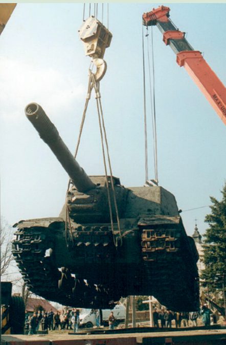
Usunięcie działa pancernego z placu przed pocztą 1997 (marzec)