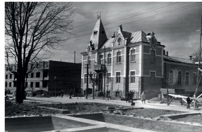
Stary Magistrat, zdjęcie z około 1960 r