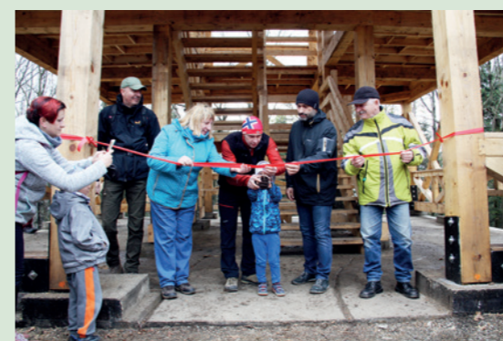
Otwarcie wieży widokowej na górze Cergowej - 27. 10. 2018