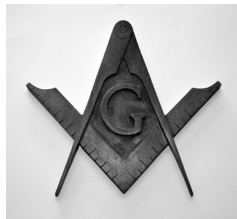
Insygnia masonskie: cyrkiel i węgielnica

Na starym szlaku handlowym, prowadzącym na Węgry, po którym szły ongiś do Polski ogromne transporty tokaju, leży Dukla — miasteczko założone w XIII wieku, sławne z wielu wydarzeń historycznych. W 1474 roku złupił je i spalił Maciej Korwin. Miasto odbudowało się i oglądało Jana Kazimierza, który w 1665 roku wracał ze Śląska, aby pokierować walką ze Szwedami. W XVII wieku Dukla przeszła na własność Mniszechów. Tutaj w 1755 roku Jerzy August Mniszech, marszałek nadworny koronny, założył lożę masonską. Loże masonskie zaczęły powstawać już w średniowieczu. Skupiały one budowniczych, tzw. wolnych mularzy, którzy różnili się tym od zwykłych mularzy, że byli wykształceni. Loże zajmowały się kultywowaniem tradycji i tajemnic cechowych. O średniowiecznych lożach mamy bardzo mało wiadomości. Wznowienie loż wolnomularskich nastąpiło w 1717 r., kiedy to architekt Wren, budowniczy Katedry św. Pawła w Londynie postanowił założyć bractwo skupiające uczestników budowy. Tradycja głosi, że akt erekcyjny został dokonany w jednej z londyńskich gospód, co sugeruje, że w trakcie uroczystości nie żałowano rumu. Członkowie loż zakładali sobie za cel duchowe doskonalenie oraz krzewienie zasad sprawiedliwości, odwagi i dobroczynności. Wkrótce jednak wolnomularstwo włączyło w ramy swoich zainteresowań naukę magów egipskich, żydowskich kabalistów, gnostyków i tem-