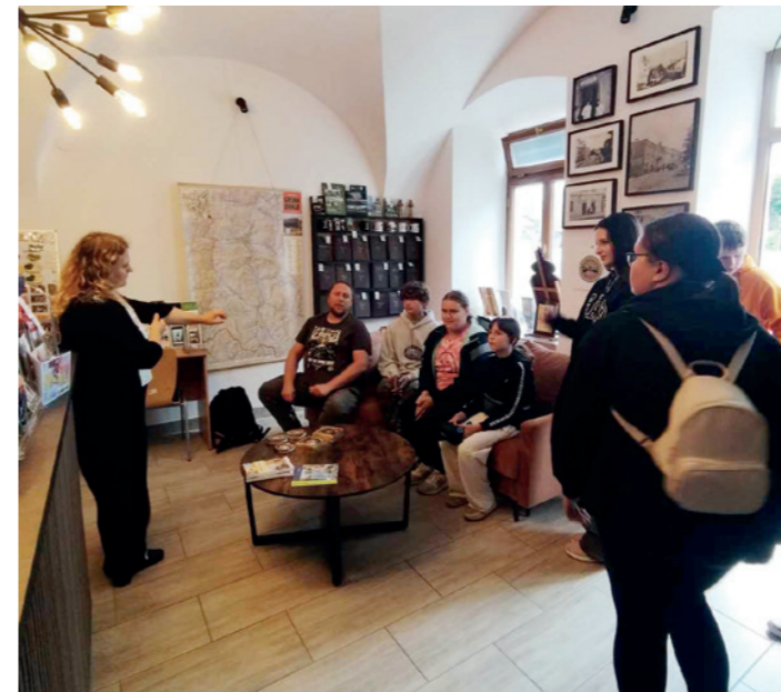
Uczestnicy projektu Saga Dukli - Karpacki Artbook z wizytą w Transgranicznej Informacji Turystycznej