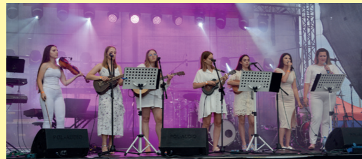
Występ zespołu In Caleo