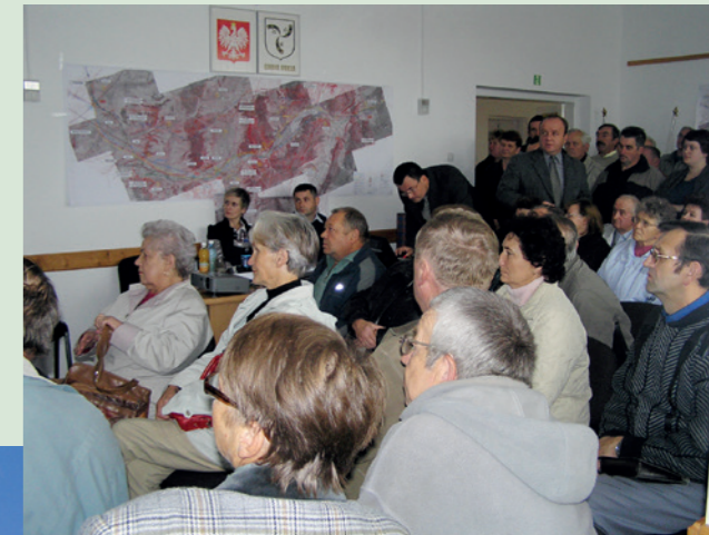
Spotkanie w sprawie przebiegu drogi szybkiego ruchu S-19 - wrzesień 2008 rok