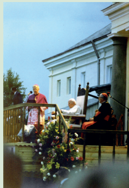
Ojciec święty Jan Paweł II pozdrawia mieszkańców gminy Dukla i pielgrzymów - 9 czerwca 1997