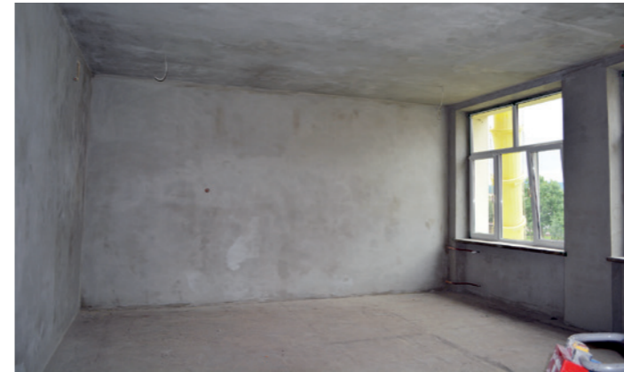
Jedna z klas na 1. piętrze