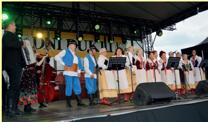
Szarotka - Duklanie wraz z Kapelą Duklanie