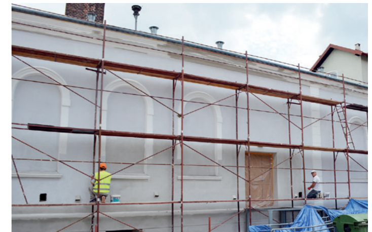
Nakładanie farby na elewację z północnej strony