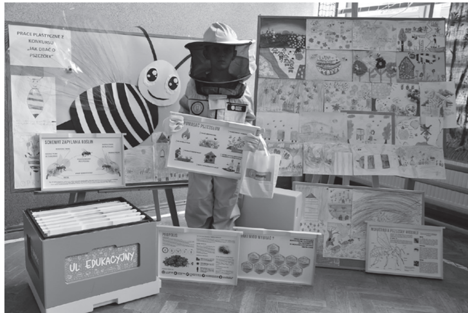
Prace uczniów uczestniczących w konkursie plastycznym