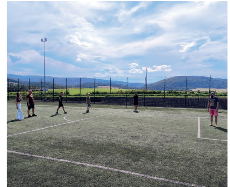
Zajęcia na orliku w Tylawie