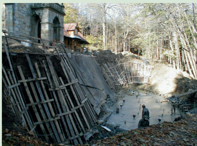
Prace zabezpieczające kościółek przed osuwiskiem ziemnym na Pustelni św. Jana w Dukli w Trzcianie 2001 rok