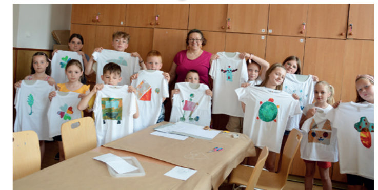
Efekt warsztatów - koszulki z własnoręcznie wykonanymi nadrukami