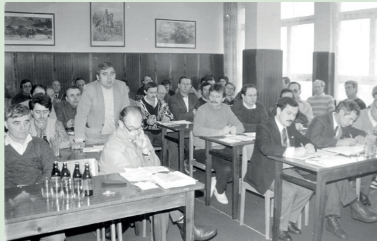
Sesja Rady Miejskiej I kadencji 1992 rok