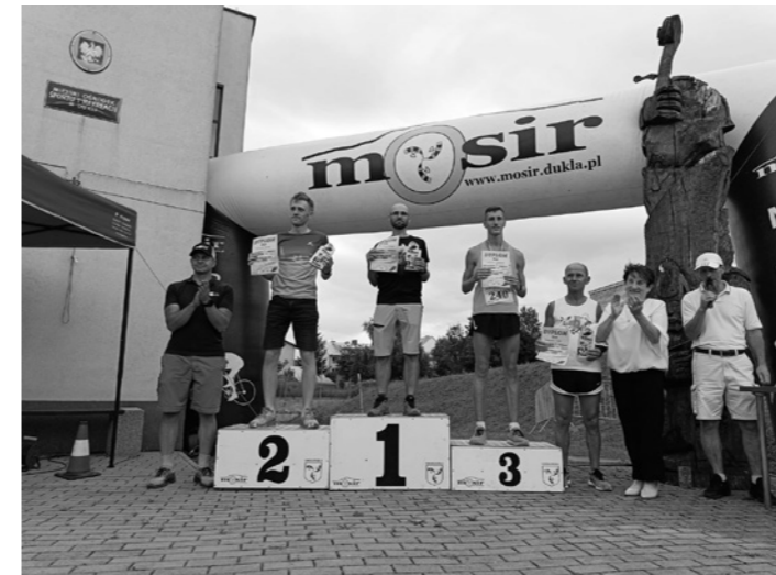
Fot. Najszybsze kobiety i najszybsi mężczyźni w biegu św. Jana z Dukli