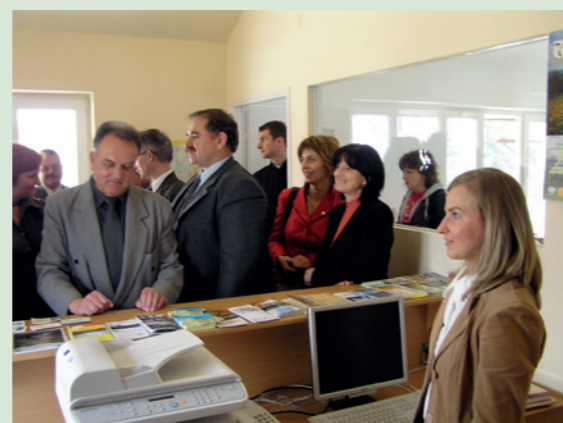
Otwarcie Transgranicznej Informacji Turystycznej w dukli (I piętro DA) - 2006 r.