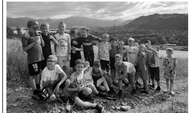
Uczestnicy turnieju zwiedzają okolicę