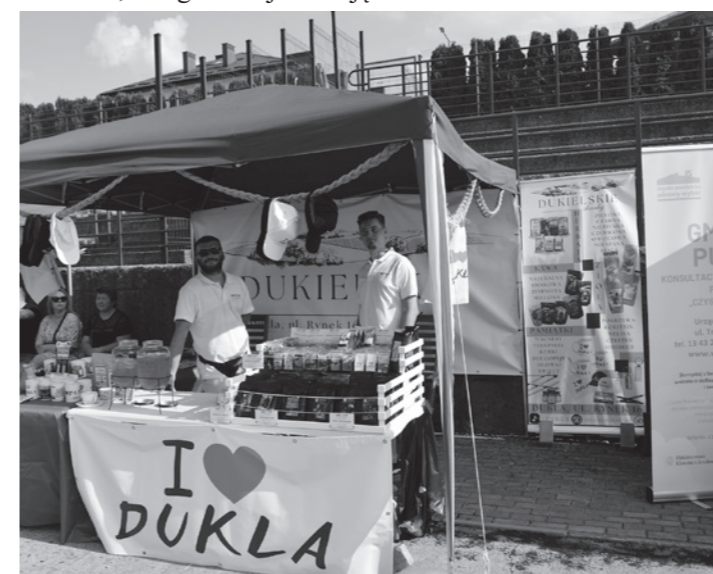
Stoisko Dukielskie Skarby