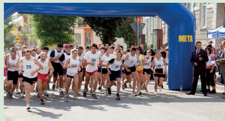
Bieg na górę Cergowa rozpoczęty - październik 2011 rok