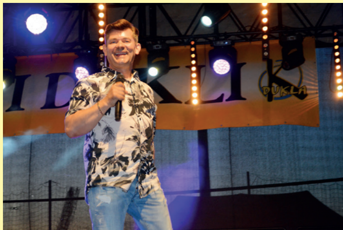
Gwiazdą sobotniego wieczoru Dni Dukli 2024 był Zenon Martyniuk