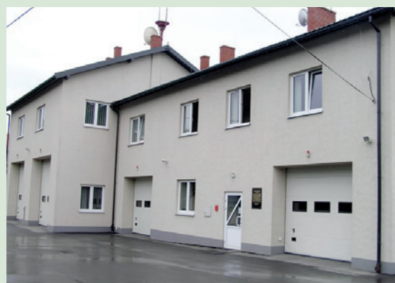
Baza Ratownictwa Ogólnego w Dukli - 2005