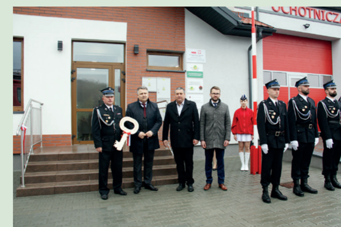
Uroczyste otwarcie remizy OSP w Tylawie - 30. 04. 2023