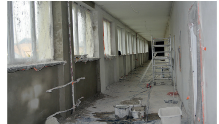
Stan prac na korytarzu - 2. piętro