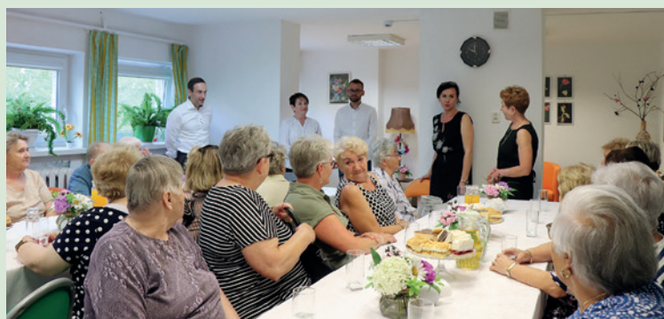
Spotkanie w Klubie Seniora w Dukli, inauguracja IV edycji