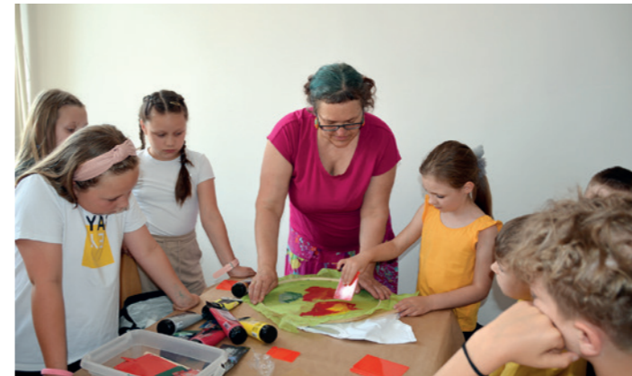
Uczestnicy warsztatów z instruktorką