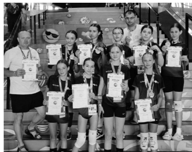
Nasze zawodniczki z trenerami

Podróż trochę męcząca, na szczęście bezpieczna. Weryfikacja szybka i sprawna. Kolacja i czas na odrobinę relaksu, kibicując polskim siatkarzom. A już od jutra pełne skupienie, koncentracja i walka o jak najlepszy wynik.