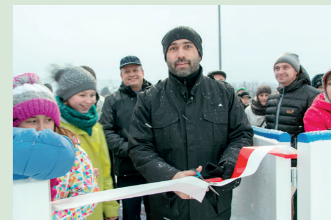
Otwarcie lodowiska MOSIR Dukla - grudzień 2014