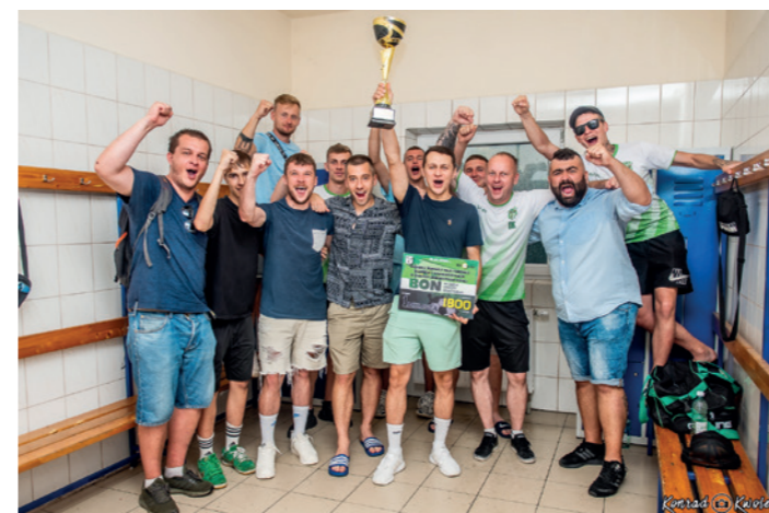
Puchar Burmistrza Dukli dla KS Przełęcz Dukla