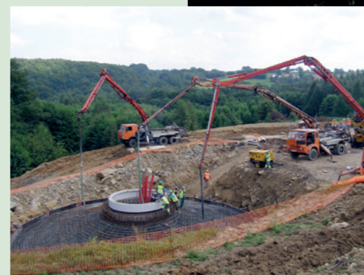
Budowa wiatraków Łęki Dukielskie - 2008 rok