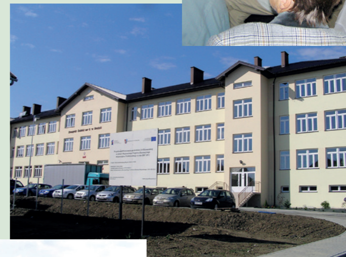
ZS nr 2 w Dukli - 2010 rok