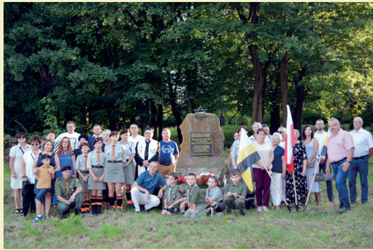
Uczestnicy uroczystości w Dukli