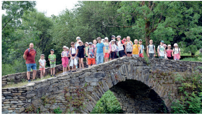
I Turnus Półkolonii z Ośrodkiem Kultury - rajd pieszy Polany-Olchowiec