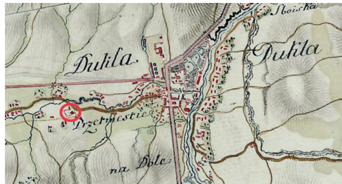
Ryc. Fragment mapy Miega, z zaznaczoną lokalizacją kościoła św. Marcina