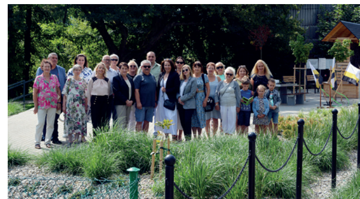
Uczestnicy spotkania na bulwarze