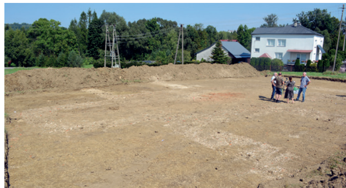
Widoczne fundamenty kościoła św. Marcina - 21 sierpnia 2024 r.