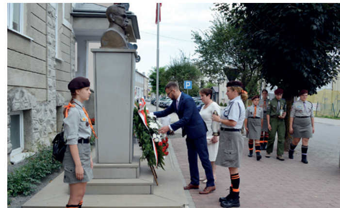
Składanie wieńca pod pomnikiem Marszałka Józefa Piłsudskiego