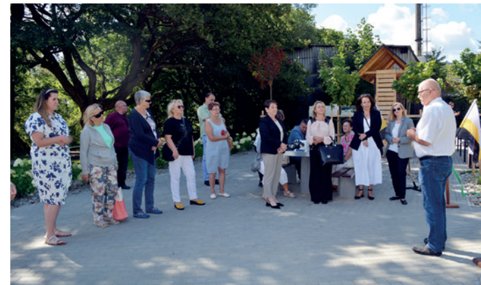
Przewodniczący Zarządu Osiedla w Dukli opowiada historię powstania bulwaru nad Jasiołką