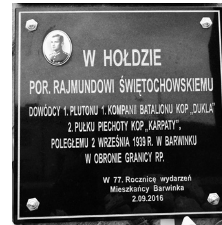
Pamiętkowa tablica porucznika w Barwinku

ufundowała pamiętkową tablicę informującą o śmierci swego brata porucznika Rajmunda Świętochowskiego.