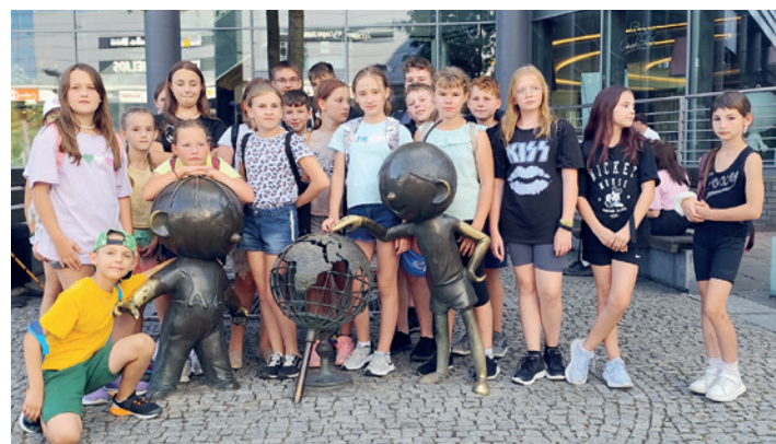
Przed studiem filmowym OKO w Bielsku Białej