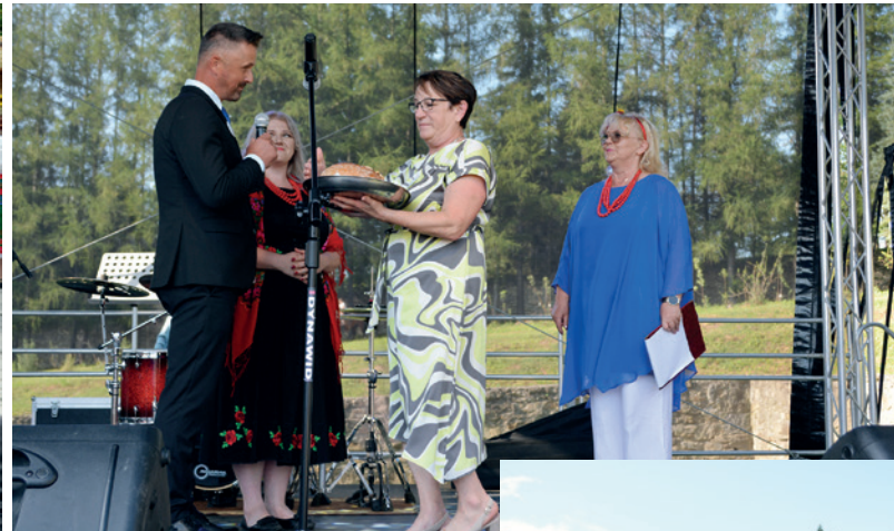
Burmistrz Dukli odbiera chleb dożynkowy z rąk starostów Dożynek Gminnych