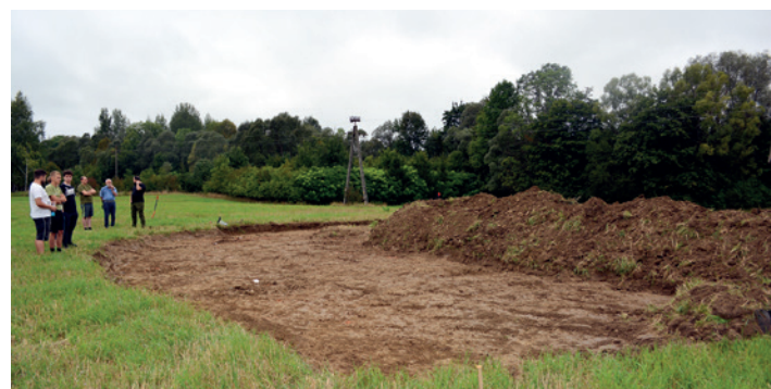
Rozpoczęcie prac archeologicznych w Teodorówce - pierwsze odkrywki - 20 sierpnia 2024 r.