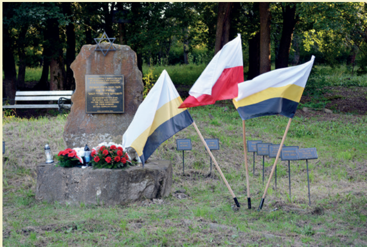
Obelisk upamiętniający pomordowanych Żydów 13 sierpnia 1942 r.