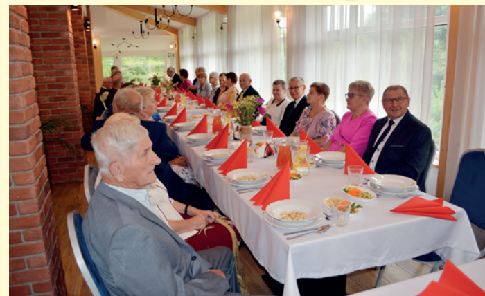
Uczestnicy uroczystości Złotych Godów w restauracji „Bartnik” w Tylawie