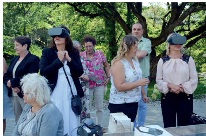
Emocje wzbudziły wirtualne wycieczki w goglach VR