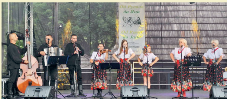
Kapela Duklanie podczas łemkowskiego święta „Od Ruszal do Jana” w Zydranowej