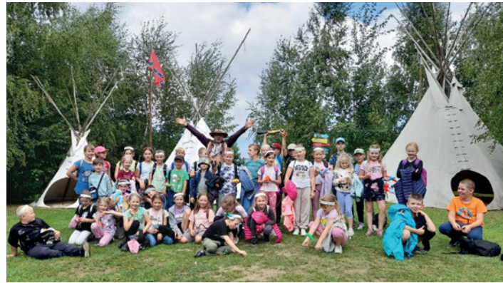
II Turnus Półkolonii z Ośrodkiem Kultury w Dukli w indiańskiej wiosce