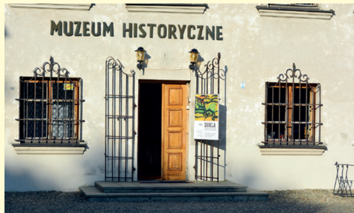
Zaproszenie na wystawę