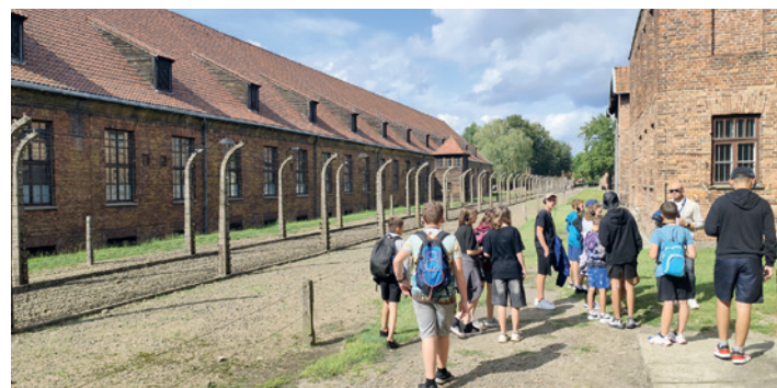
Uczestnicy kolonii w muzeum Auschwitz-Birkenau