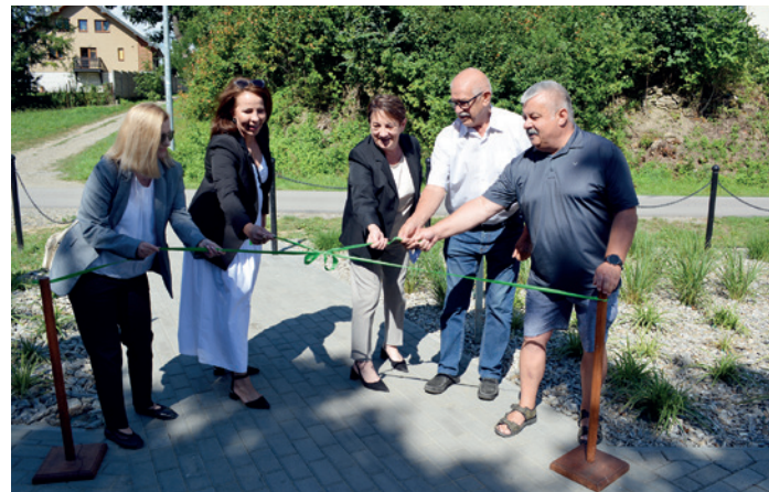
Rozwiązanie wstęgi symbolizujące zakończenie projektu