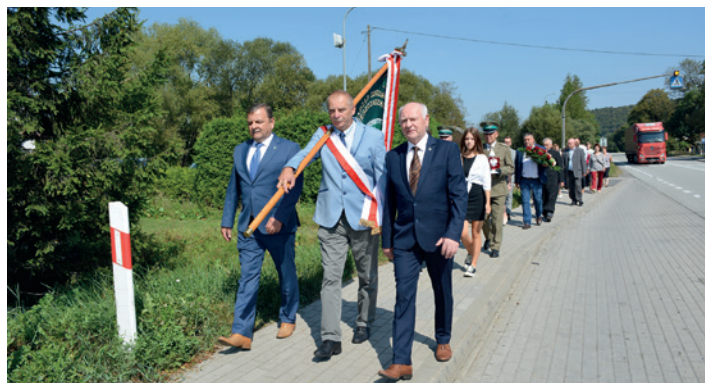
Przebieg uczestników uroczystości pod pomnik przy Domu Ludowym