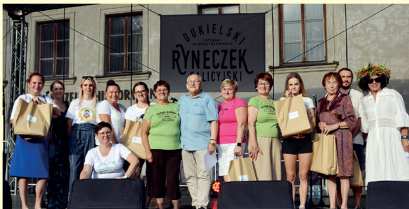
Zwycięzcy w konkursie na najlepszego proziaka