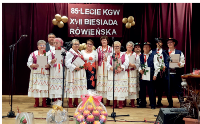
Zespół „Równianie” z burmistrzami Dukli