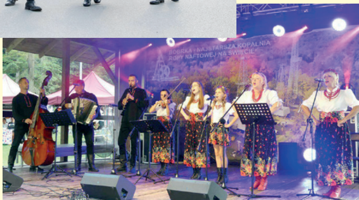
Kapela Duklanie podczas festiwalu historycznego teraźniejszość czasu przeszłego w Bóbrce