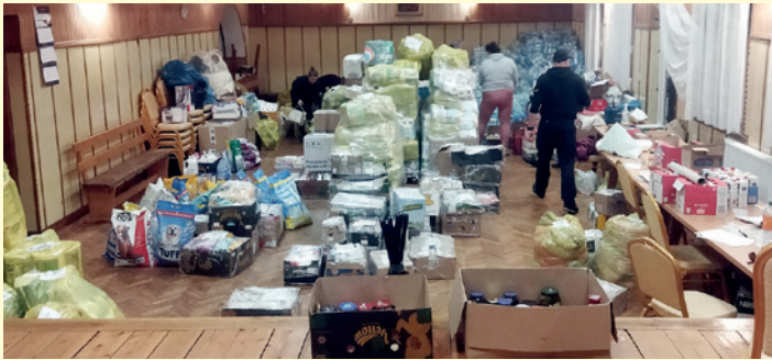
Magazyn darów w DL w Cergowej