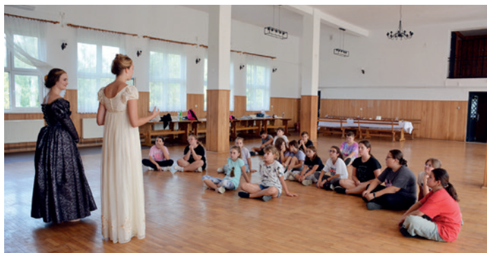
Uczestnicy warsztatów tańców historycznych

Dofinansowano ze środków budżetu Województwa Podkarpackiego