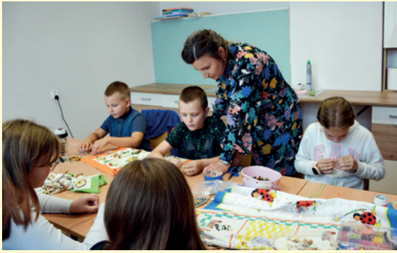
Zajęcia z biżuterii