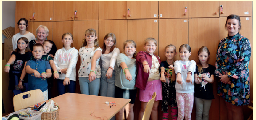
Uczestnicy warsztatów z instruktorkami