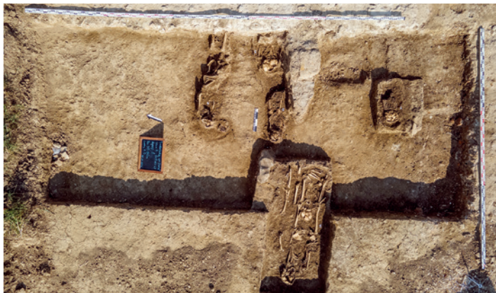
Wykop 1 - Teodorówka