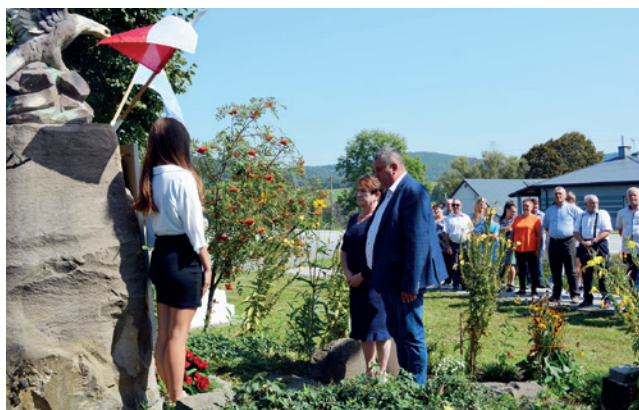
Burmistrzowie Dukli złożyli wieniec pod pomnikiem upamiętniającym żołnierzy WOP i SG