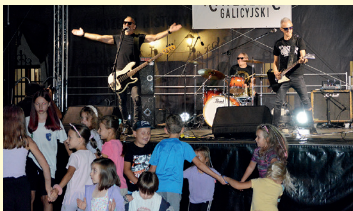
Występ zespołu „Latające Talerze”