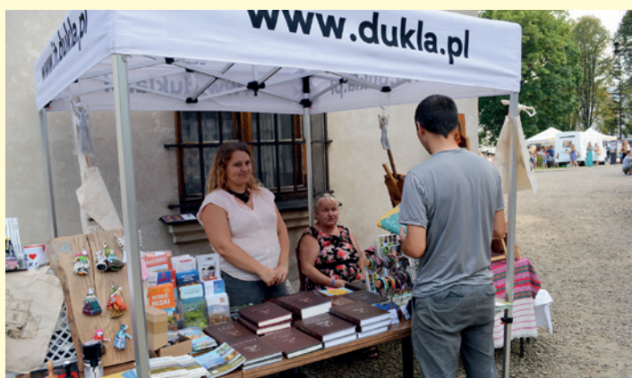
Stoisko promocyjne Gminy Dukla i Transgranicznej Informacji Turystycznej