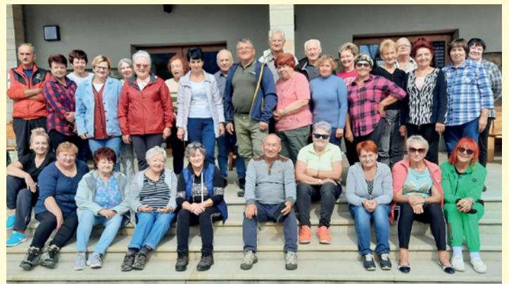
Uczestnicy rajdu Olchowiec - Polany z przewodnikiem