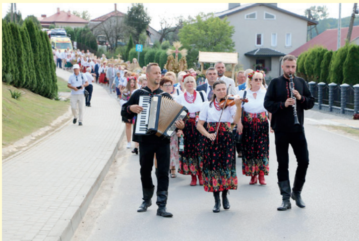
Kapela Duklanie prowadząca korowód dożynkowy w Kopytowej