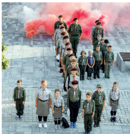
Uroczysty apel na dukielskim rynku