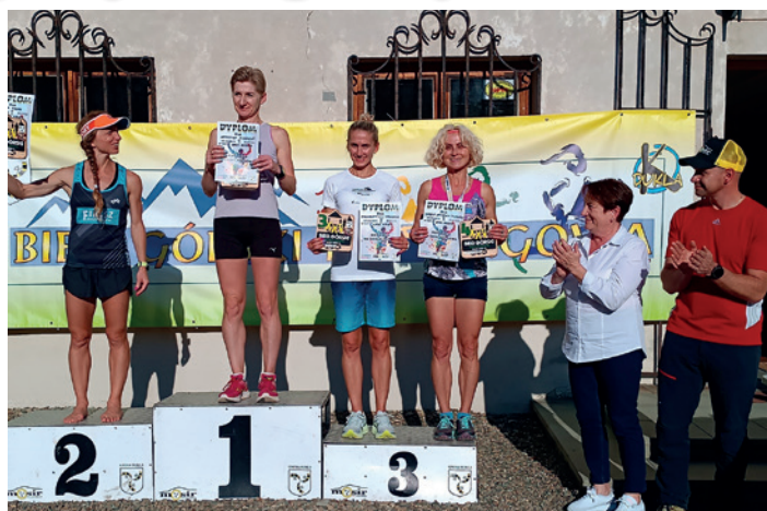
Najszybsze kobiety z burmistrz Dukli i dyrektorem MOSiR