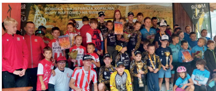
Uczestnicy Podkarpackiej Ligi Rowerowej w Bobrcu