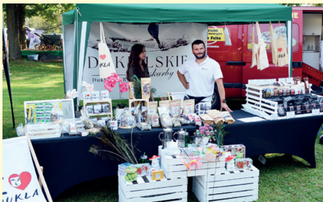
Dukielskie Skarby - prezentacja produktów