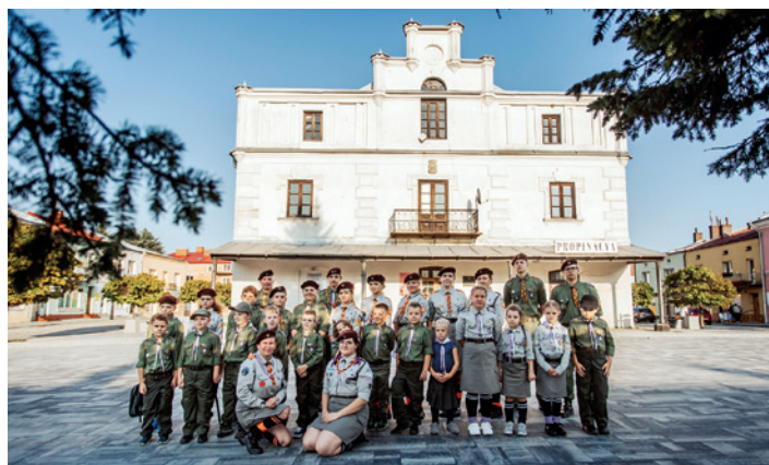
Uczestnicy apelu przed ratuszem w Dukli