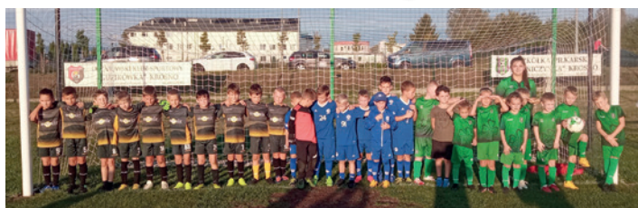
Rozpoczęcie Ligi na stadionie w Krośnie