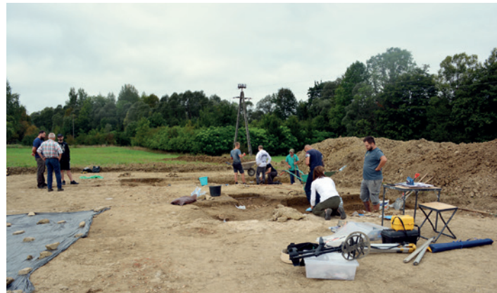
Prace archeologiczne w Teodorówce w toku