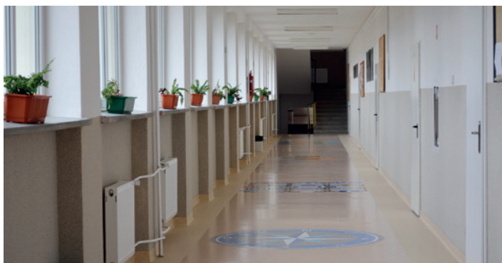
Korytarz oraz jedna z sal lekcyjnych po modernizacji