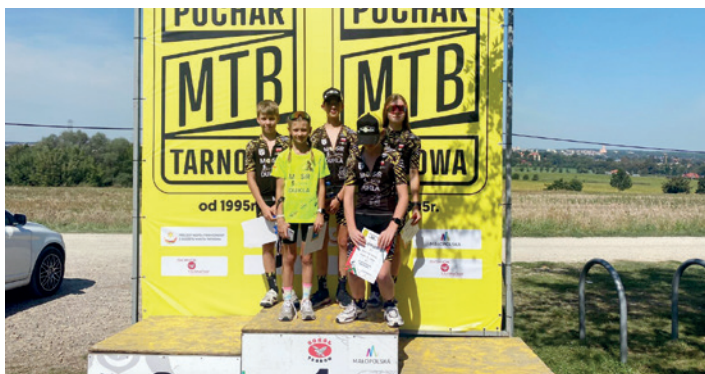
Dukielscy zawodnicy w Tarnowie