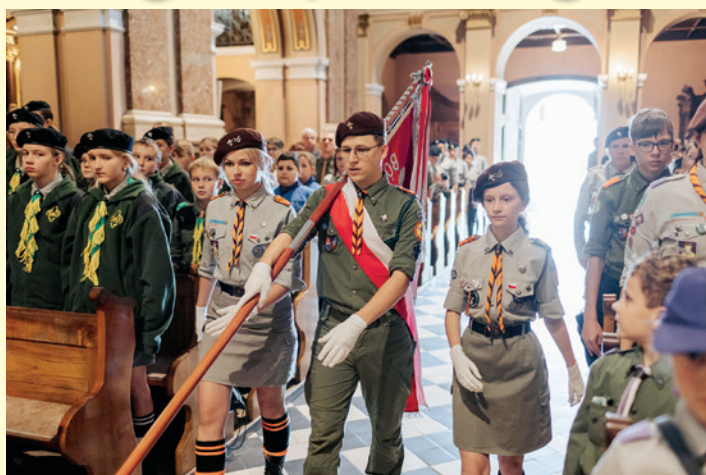
Wprowadzenie sztandaru do kościoła