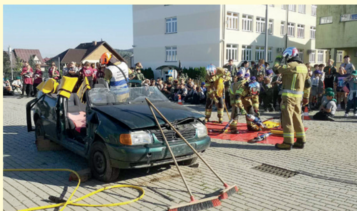
Pokaz symulowanego wypadku drogowego w wykonaniu strażaków z OSP w Dukli i Tyławie