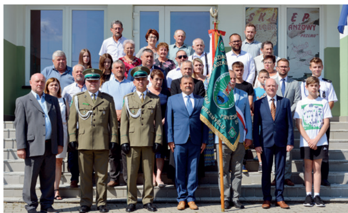
Wspólne pamiątkowe zdjęcie