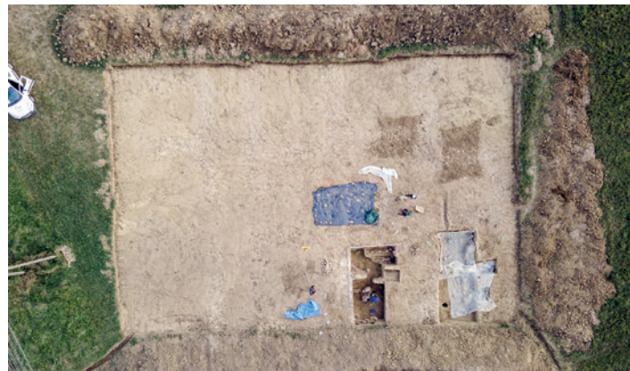
Stan prac archeologicznych w Teodorówce na wrzesień 2024