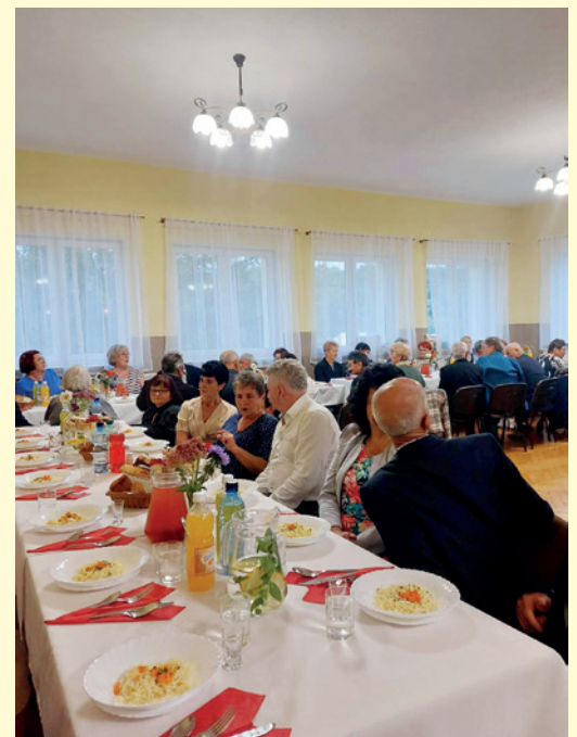
Spotkanie w DL w Zboiskach