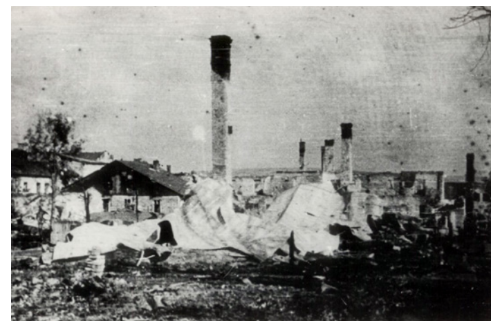
Dukla - październik 1944 rok