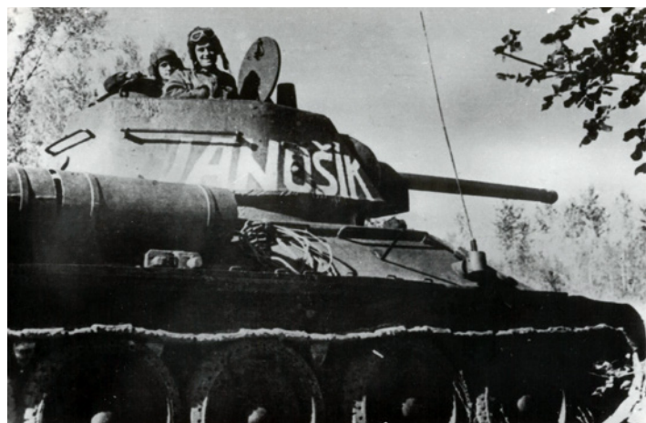
I Korpus Czechosłowacki