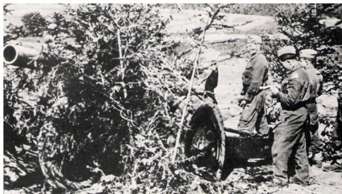
Dziła Korpusu Czechosłowackiego