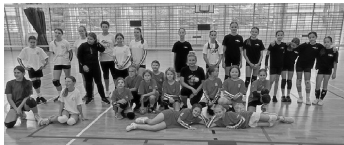
Uczestnicy zawodów w Dębicy