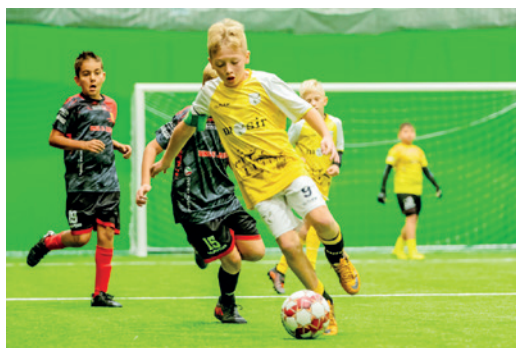
Zawodnicy podczas gry