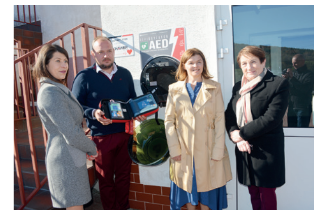
Prezentacja defibrylatora przez sponsorów