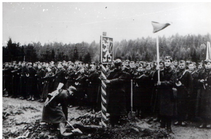
Przełęcz Dukielska 6 października 1944 rok

Straty wojsk sowieckich wyniosły w zabitych, rannych i zaginionych ok. 123 tysiące, a wojsk czechosłowackich ok. 6,5 tys. Straty wojsk niemieckich i wspierających je wojsk węgierskich szacuje się na 55 - 70 tys. ludzi.