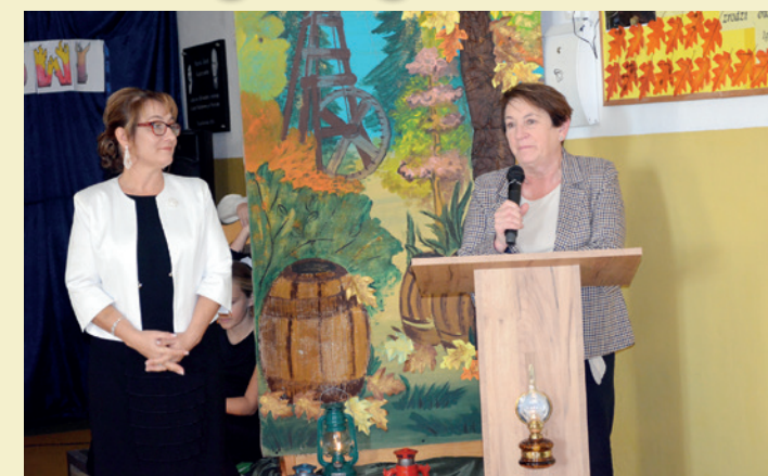
Gratulacje dla p. dyrektor szkoły od burmistrz Dukli