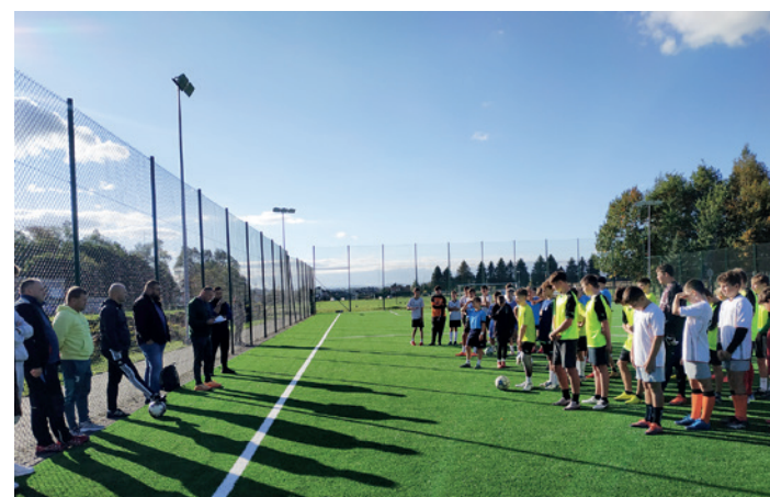
Drużyny uczestniczące w rozgrywkach w Korczynie