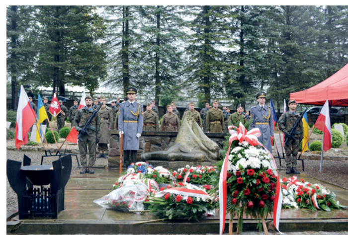
Warta honorowa przy pomniku Żołnierza na Cmentarzu Wojennym w Dukli