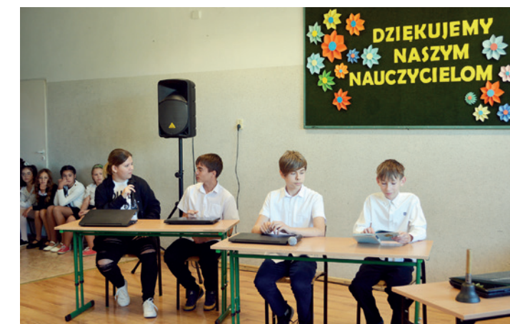
Scenka rodzajowa w wykonaniu uczniów ze SP w Tylawie