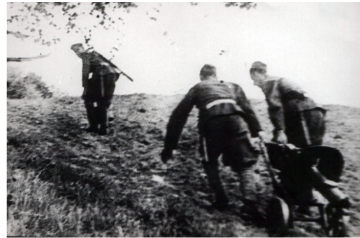
Żołnierze Korpusu Czechosłowackiego na Chyrowej