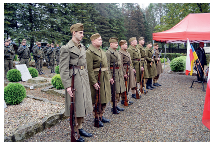
W uroczystościach wzięła udział grupa rekonstrukcyjna z Czech