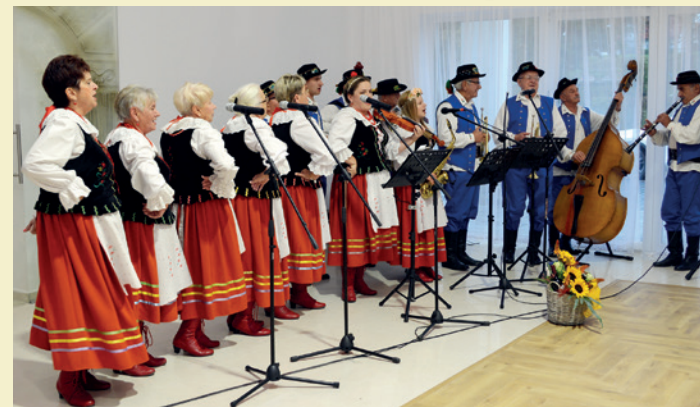
Zespół „Łęczanie” podczas Jubileuszu 20lecia