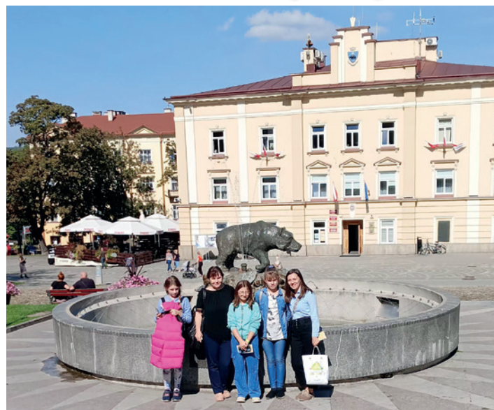
Uczestniczki delegacji w Przemyślu