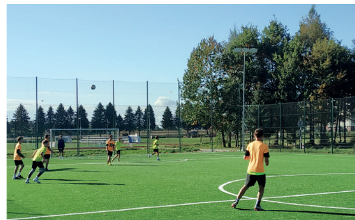
Podczas jednego z meczy