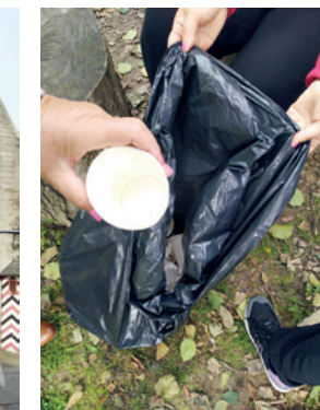
Zbieranie śmieci przed bunkrem w Stępinie