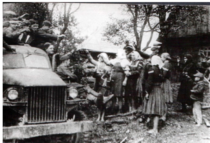
Wyżny Komarnik 1944 rok

Po dojeździe wojsk sowieckich do rzeki Ondavy zakończyła się Operacja Karpacko - Dukielska, która jest uważana za największą operację górską w II wojnie światowej, a przy tym była jedną z najkrwawszych bitew tej wojny.