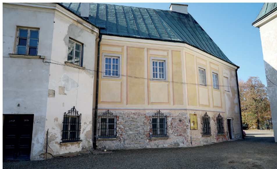
Oficyna pałacowa z fragmentem odnowionej polichromii