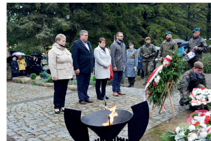
Przedstawiciele dukielskiego samorządu złożyli wieńce