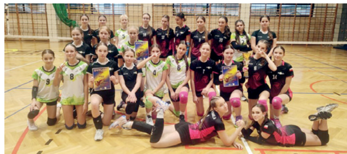
Zawodniczki drużyn biorących udział w turnieju