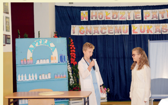
Scenka rodzajowa w wykonaniu uczniów szkoły