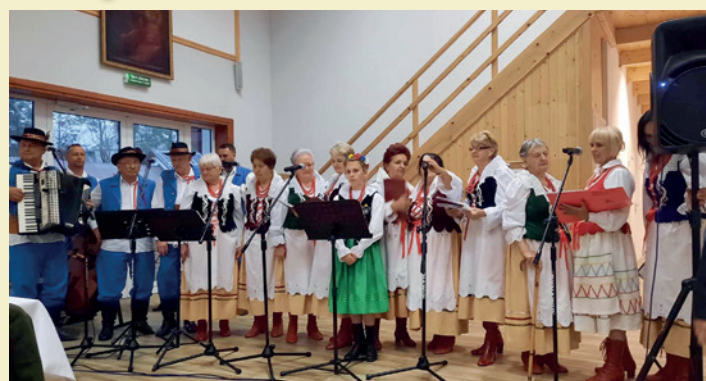
Występ Zespołu Szarotka-Duklanie i Kapeli Duklanie