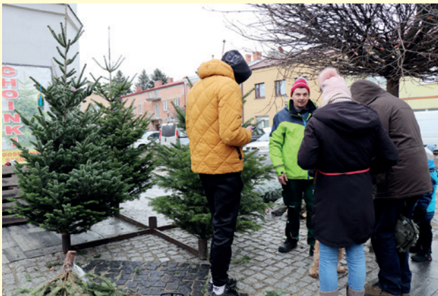
Można było również zakupić choinki i piękną ceramikę