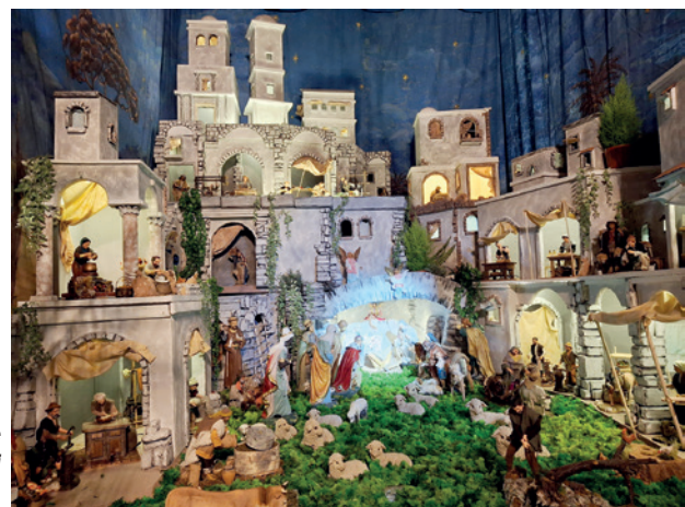
Ruchoma szopka w kościele pw. św. Jana z Dukli