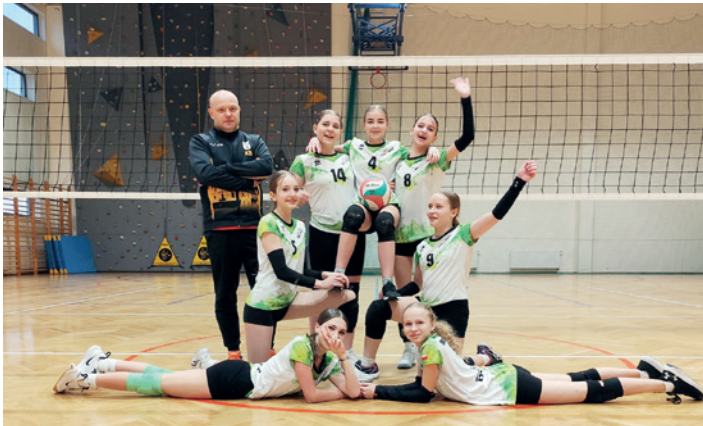
Zawodniczki z trenerem