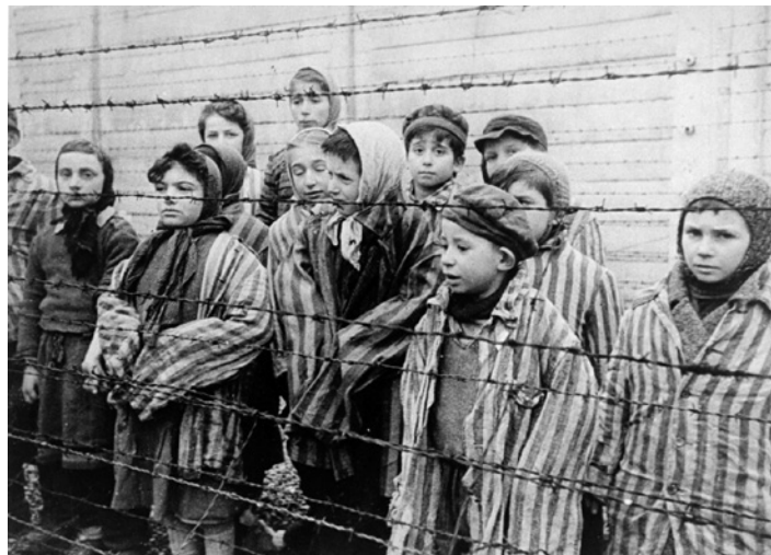
Dzieci żydowskie w wyzwolonym obozie Auschwitz. Kadr z radzieckiego filmu Aleksandra Woroncowa, kręconego od 28 stycznia 1945 r.

27 stycznia 1945 r. mija 80 lat od wyzwolenia przez żołnierzy 60. Armii Pierwszego Frontu Ukraińskiego obozu koncentracyjnego w Oświęcimiu (KL Auschwitz). Więźniowie witali żołnierzy radzieckich jako autentycznych wyzwolicieli. Paradoks historii sprawił, że żołnierze będący przedstawicielami totalitaryzmu stalinowskiego, przynieśli wolność więźniom totalitaryzmu niemieckiego. Wojska radzieckie otrzymały bliższe informacje o Auschwitz dopiero po wyzwoleniu Krakowa (17 stycznia 1944 roku) i w związku z tym nie były w stanie dotrzeć do bram obozu przed 27 stycznia 1945 r. Organizacja Narodów Zjednoczonych uchwaliła w 2005 roku 27 stycznia Międzynarodowym Dniem Pamięci o Ofiarach Holokaustu.