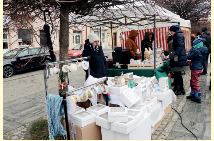
Stoiska kiermaszowe prezentujące ozdoby świąteczne