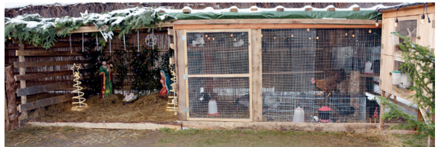
Święta Rodzina z żywym inwentarzem