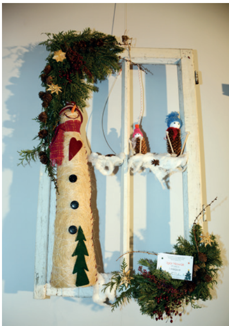
Igor Nowak (SP Głojсце) - 1. miejsce szopki, kat, II