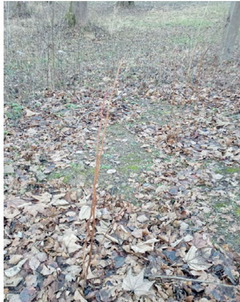
Sadzonki Pęcherznicy kalinolistnej przy Cmentarzach Wojennych w Dukli