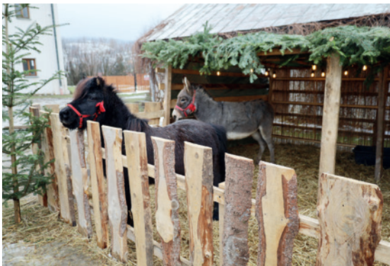
Kucyk i osioł