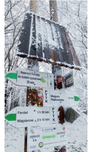
Te białe włosy to działalność tojówki różowej