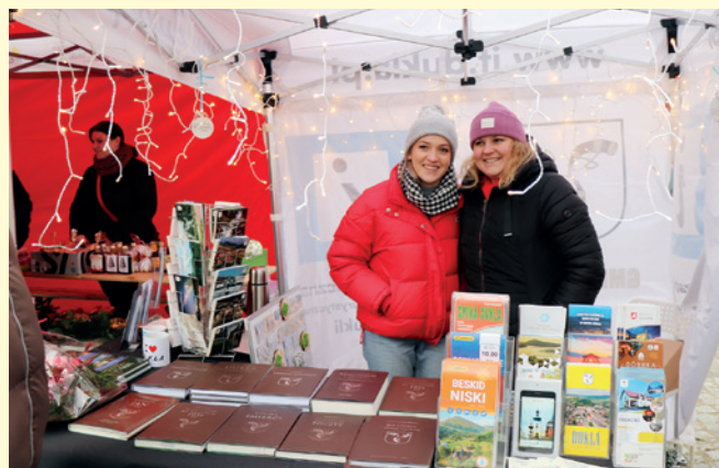
Stoisko Informacji Turystycznej w Dukli