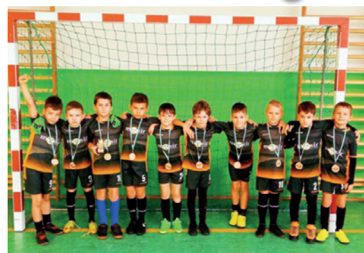
Zawodnicy MOSiR Dukla