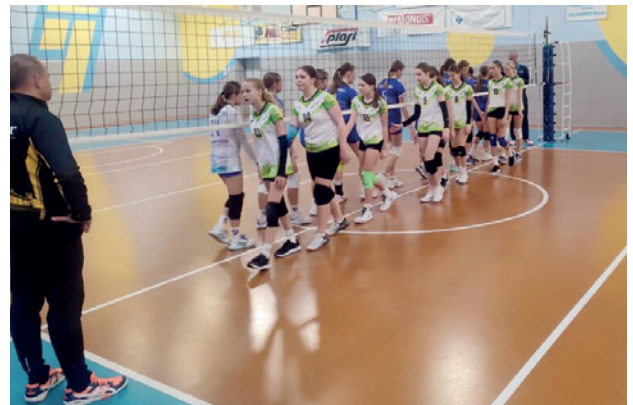
Zawodniczki uczestniczące w lidze