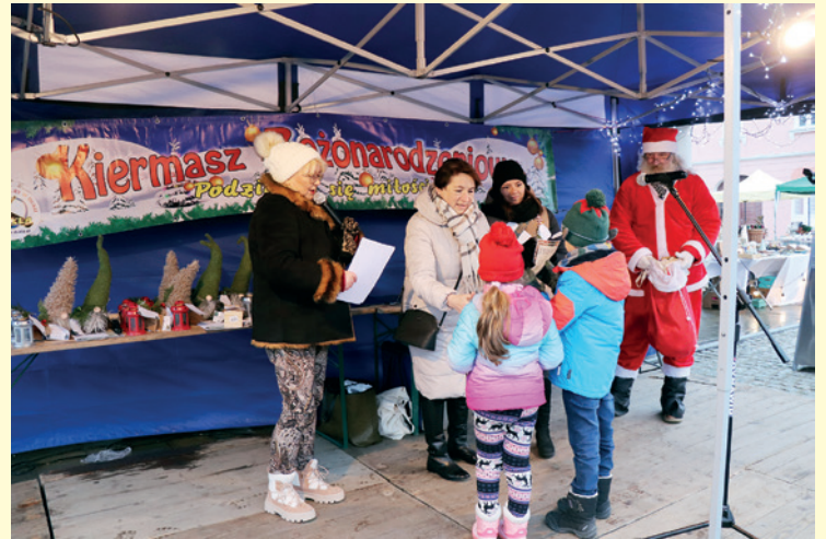
Zwycięzcom konkursu na najpiękniejszą szopkę wręczała nagrody burmistrz Dukli