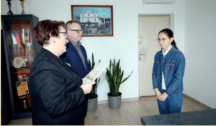
Wręczenie nagrody sportowej za wybitne osiągnięcia