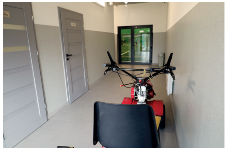
Korytarz z widokiem na halę