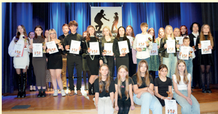
Laureaci XVII Powiatowego Konkursu Piosenki Obcojęzycznej