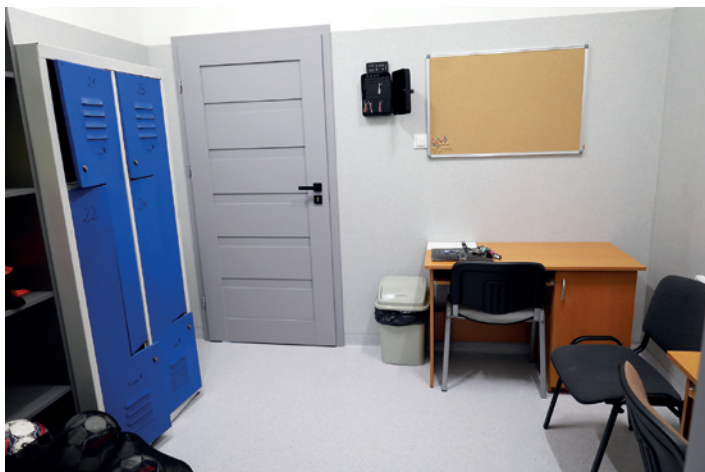
Pomieszczenie dla trenerów