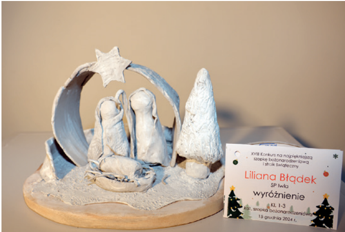
Liliana Błądek (SP Iwka) - wyróżnienie szopki, kat I