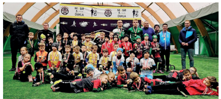
Zawodnicy rocznika 2017 biorący udział w festiwalu sportowym