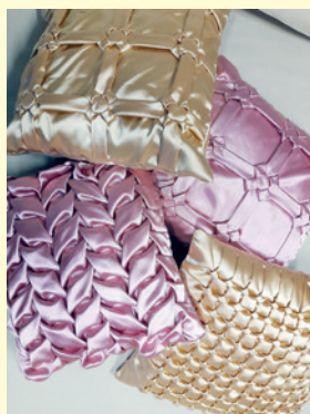
Poduszki wykonane przez uczestniczki warsztatów