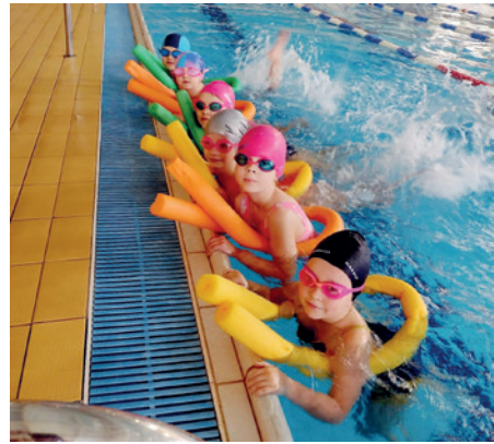
Uczestniczki nauki pływania