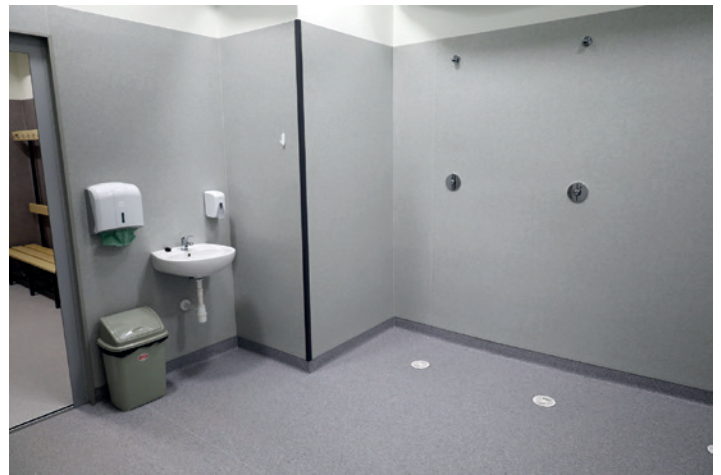
Łazienka z prysznicem