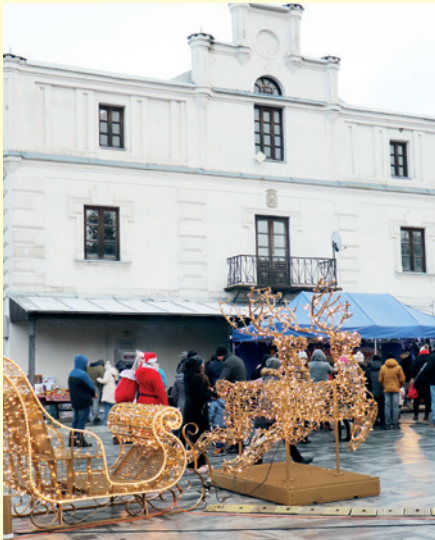
Renifery z saniami przed ratuszem