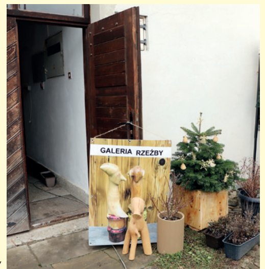
Odwiedzić można było Galerję Rzeźby