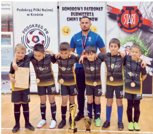
Zawodnicy z trenerem