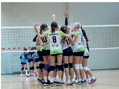
Zawodniczki MOSiR Dukla