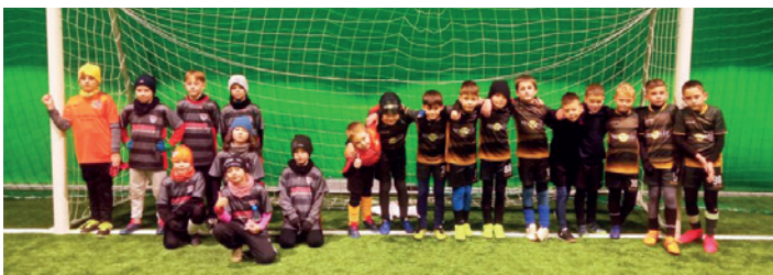
Zawodnicy uczestniczący w sparingu