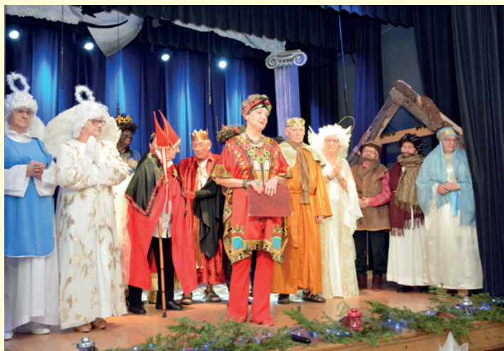
Widowisko „Anielskie Zmartwienie”