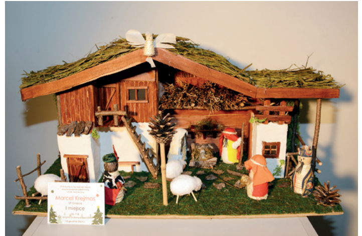
Marcel Krejmas (SP Głojсце) - 1. miejsce szopki, kat III