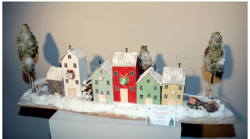
Roman Krok (SDS Cergowa) - 1. miejsce szopki, kat V